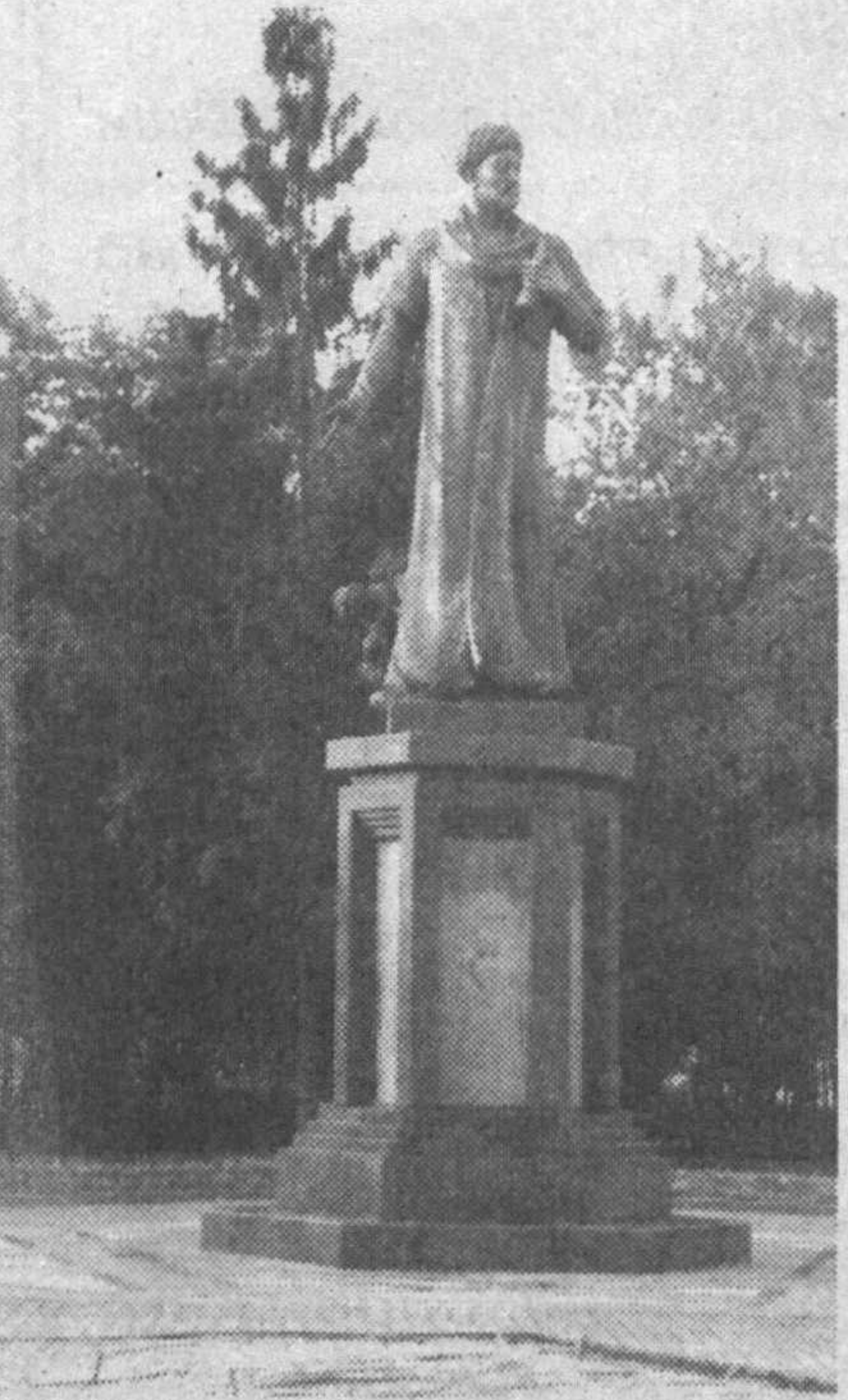
(Давоми. Боши 1-бетда.)

Шу ўринда бу улуг инсоннинг яна бир ноёб сифати хусусида тўхталиб ўтмасак, катта бир ҳақиқатдан кўз юмган бўлаемиз. Бу нодир жиҳатни мамлакатимиз Президентини мана бундай ёрқин бир тарзда таъриф этганлар: «Агар бу зотни авлиё десак, у — авлиёларнинг авлиёси, мутафаккир десак — мутафаккирларнинг мутафаккири, шоир десак — шоирларнинг султони».