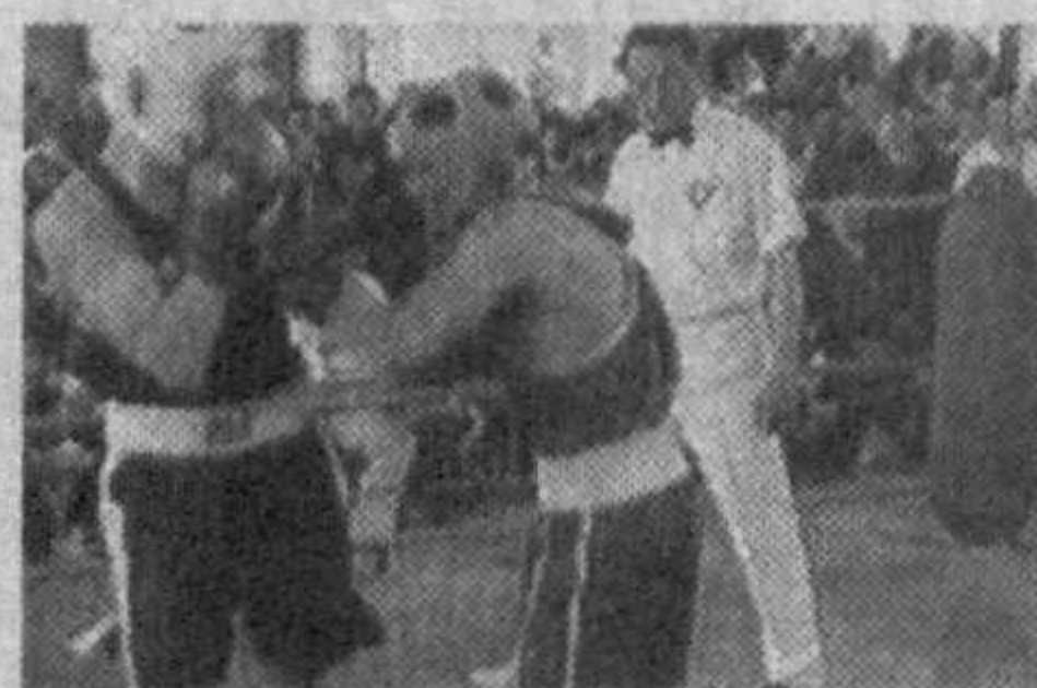
Фарғонада бокс бўйича 1986-88 йилларда туғилган ўсмирлар ўртасида Ўзбекистон биринчилиги бўлиб ўтди.

Унда Қорақалпоғистон Республикаси, Тошкент шаҳри ва вилоятлардан келган 186 нафар боксчи ғолиблик учун баҳс юритди. Биринчиликда асосий совринли ўринлар учун кураш Республика олимпия захи-ралари коллежи талабалари ўртасида кечди. Улар ўн икки вазн тоифасидан 8 тасида ғолибликни қўлга киритдилар.