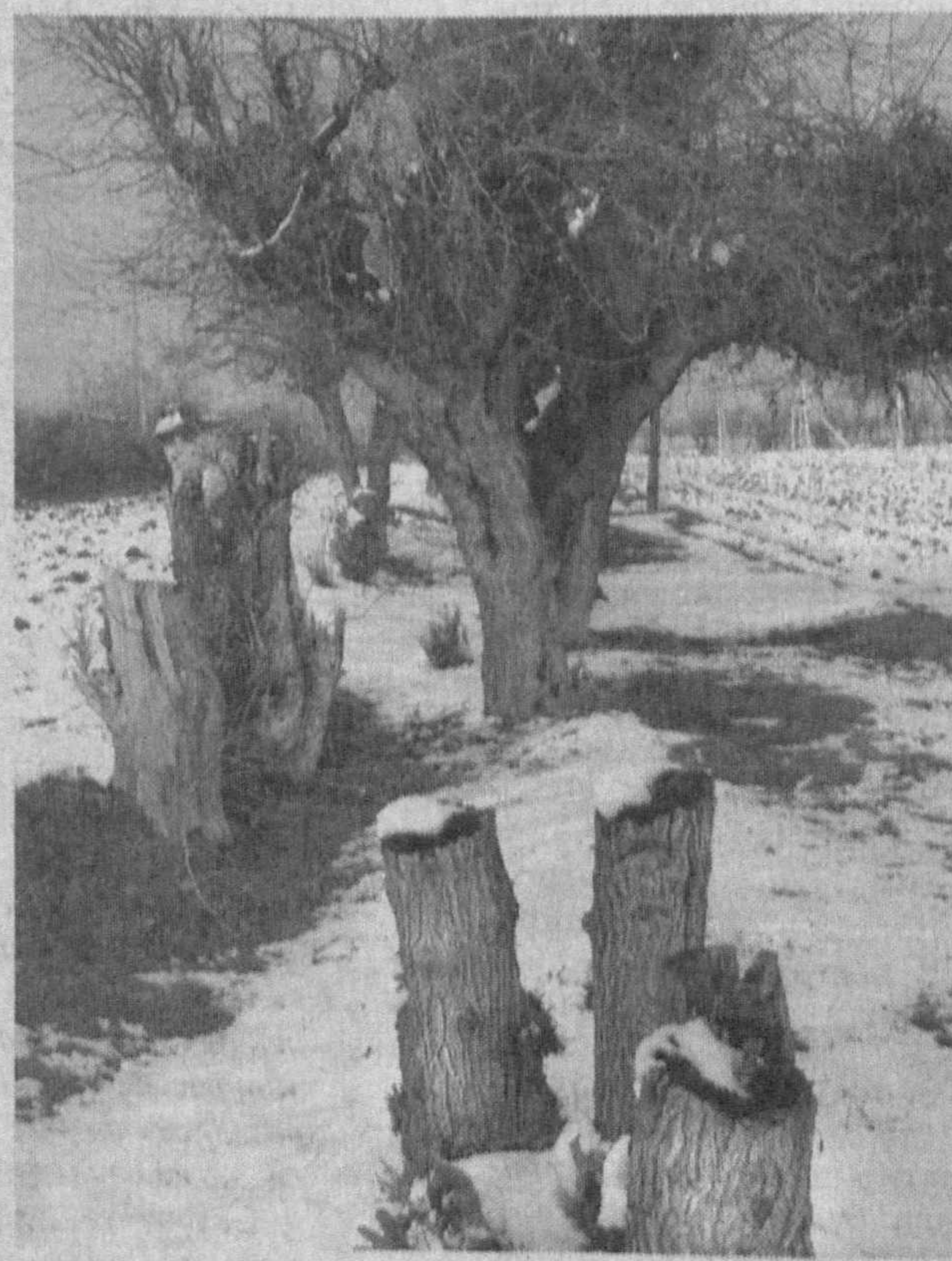
Бир туп тут эксанг, юз йил гавҳар терасан.