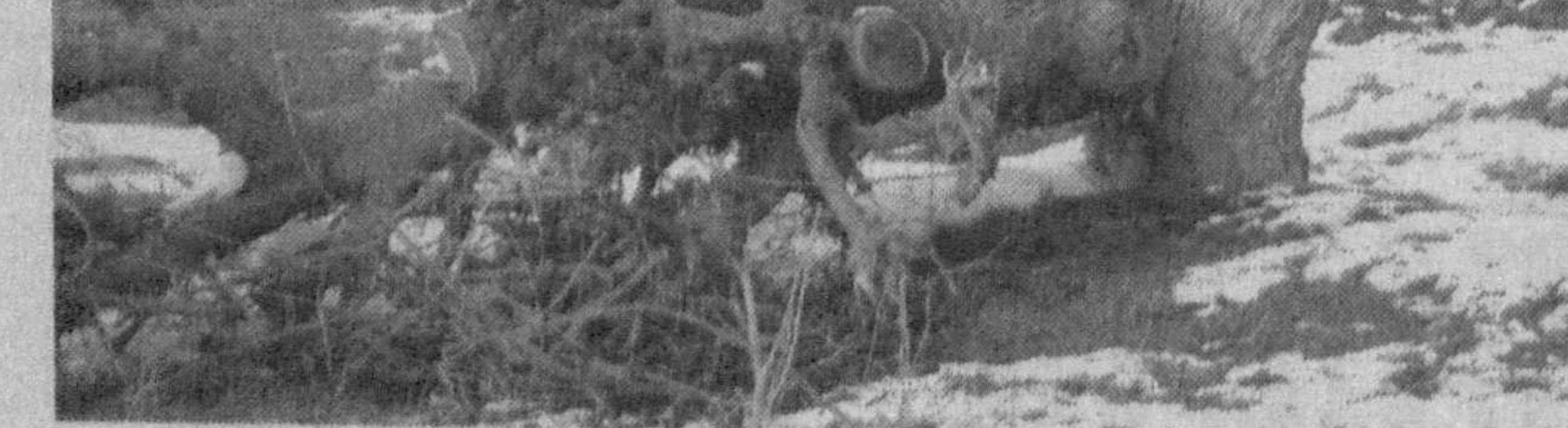
(Давоми. Боши 1-бетда.)

қорапачоқ пилла микдори 20-25 фоиздан ортиб кетди. Натижада 3,4-3,5 кг. пилладан бир кг. ипак олинди. Ҳолбуки, истиқболли режалар асосида иш юритилаётган жойларда шундай микдордаги ипак учун 2,6-2,8 кг. пилла kifья қилмоқда.