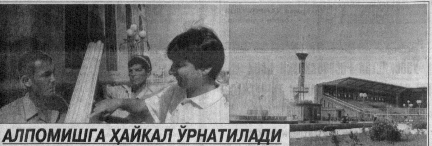
АЛПОМИШГА ҲАЙКАЛ ЎРНАТИЛАДИ

Мустақиллик байрами яқинлашган сайн юртимизнинг барча шаҳар ва қишлоқларида улкан ўзгаришлар содир бўляпти. Хусусан, олий билим оlishи учун ҳаётда ободонлаштириш ишлари диққатга сазовордир.