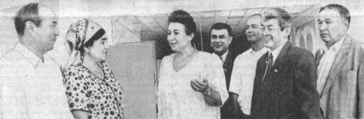
СУРАТДА: Олий Мажлис депутатларининг бир гуруҳи.

ларига, ҳуқуқни муҳофаза қилиш ва давлат бошқаруви органлари ходимларига, Юрб-шимиз асарларини ўрганаётган олимларга, шунингдек, кенг китобхоналар оммасига муъалланган. Китоб Ўзбекистон Республикаси Ички ишлар вазирлиги академияси томонидан ўзбек ва рус тилларида қўп минг нусхада нашр этилди.