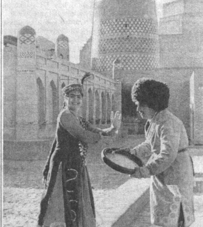
Агар Хивадаги бу минораю биноларнинг бағрида ёзув лентаси бўлганда эди, эҳ-ҳе, не бир оҳанглар, бетакроп мусиқий наволар хазинаси яратиларди. Эҳтимол, бодир ҳам, фақат биз уни ўқиймизми? Эҳтимол, келажак авлод бунчи кашф этар, санъи мусиқани деворлар орасидан «сузуриб» олар. Аммо бир нарсани аниқ: болалар қонидан ўтган оҳанглар томирларида кезиб юрибди. Хоразм оҳанглари эса уни ҳар доим жўштириб, тўқилантириб туради. Ҳатто ушбу суратга боқиб ҳам уша бетакроп оҳанглари эшитгандай бўласиз ва вуҷудингизда уй-ғонини сезасиз.