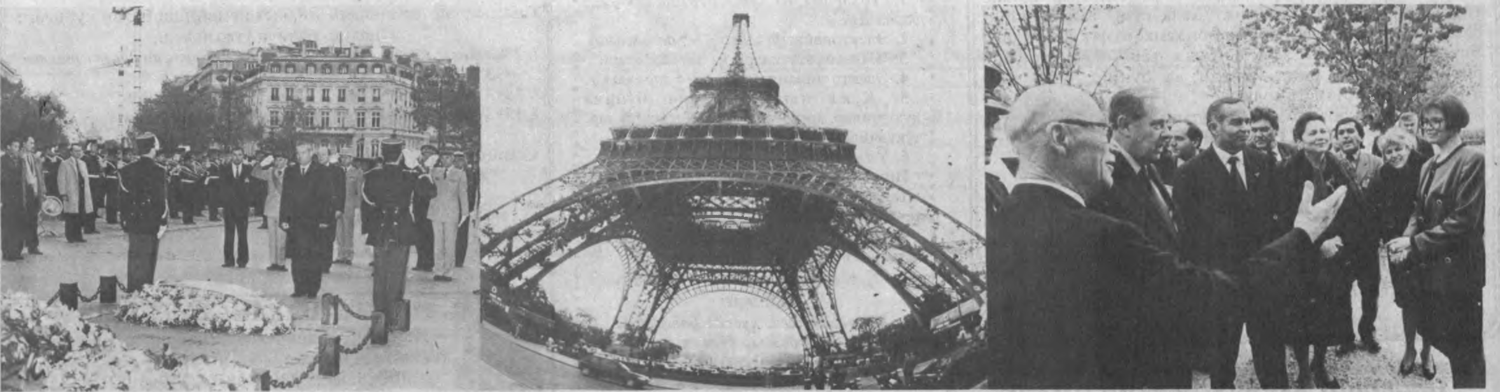
(Давоми. Бош 1-бетда).

Ишбилармонлар кенгаши вице-президенти Филипп Жискар д'Эстен олий мартабада Франциянинг ишбилармон доиралари, Франциянинг алоқаларини кенгайтиришда ўта манфаатдор эканини таъкидлади. Бироқ, улар маблағ ўтказиш, йирик лойиҳаларга сармоя сарфлашдан олдин саннат ва ишлаш ҳўжалиги ишлаб чиқаришнинг турли соҳаларидан аҳолини муфассал ўрганишлари зарур. Шунинг учун ҳам бу учрашув ҳамкорлик истикболлари ва Франция ишбилармонлар доиралари номида яндаларнинг манфаатларига оид жуда кўп саволларга жавоб бериши лозим.