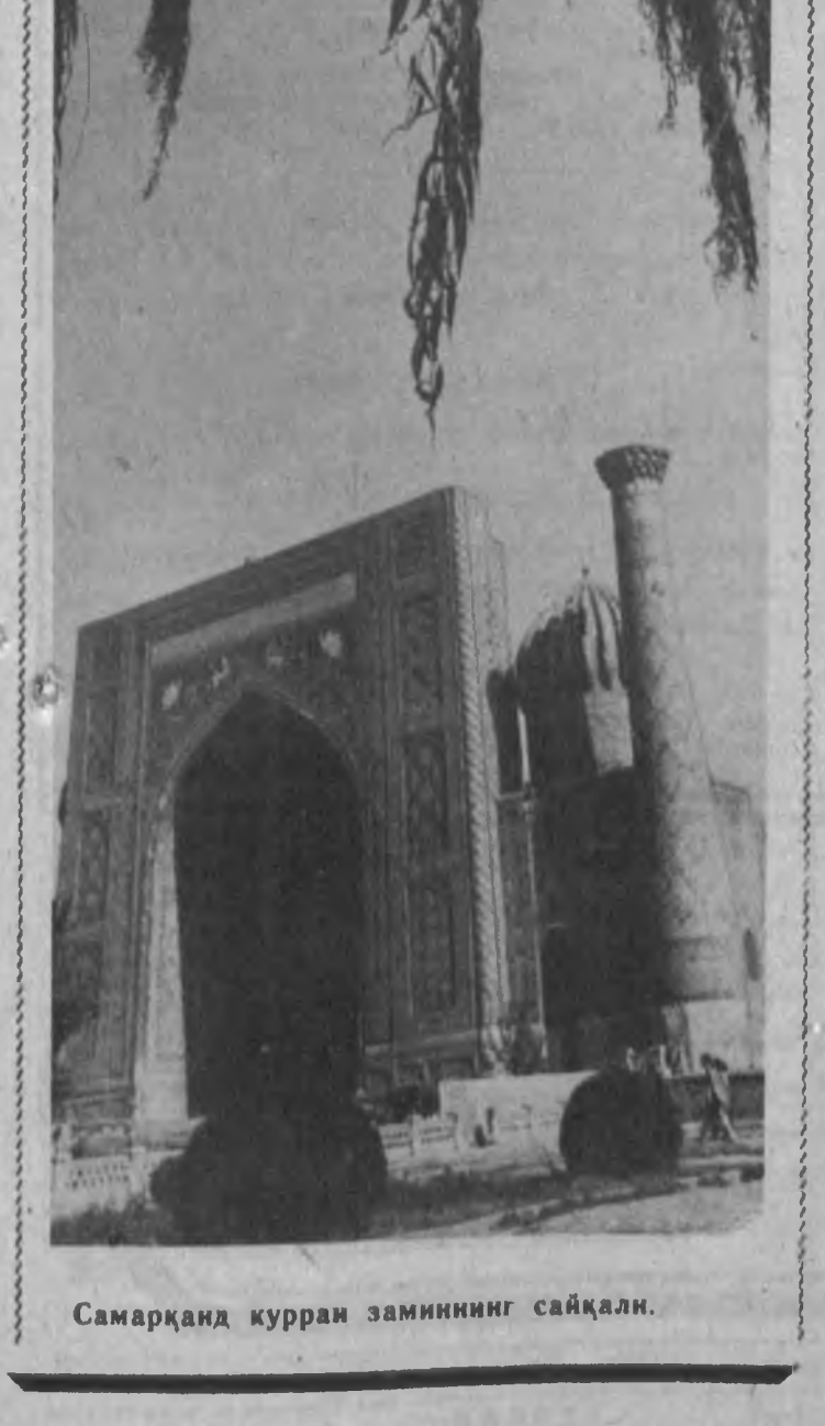
Самарқанд қурраи заминининг сайқали.