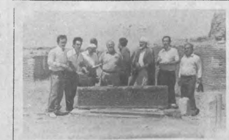
Хусайн Бойқаро қабр-мақбарасидан ана шу сағана тошнинг қилибди...