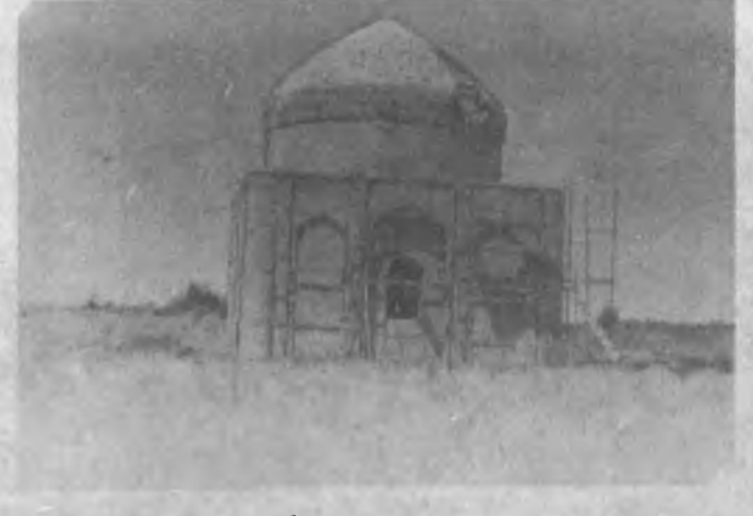
Алишер Навоий мақбараси...