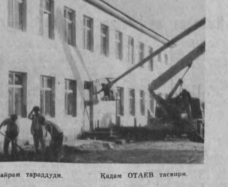
СУРАТДА: шаҳарда байрам тараддуи.