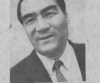
Анжуманда янраган бир-биридан таъсирчан, илмий тараққиот маърузалар мамлакатимизда

мизда ҳурфикрлик, эркин эътиқод ва маслак, тарихга, улуғлик чуқур англаган ҳолда муносабатда бўлиш каби ҳақиқатлар кенг илдиш отиб бораватганидан далолат береди, ҳар биримизни эзгуликка, ахшиликка, ватанпарварликка даъват этади.