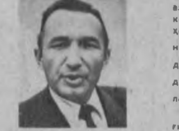
Ҳазрат Аҳмад Яссавий қадрият зират қилар эканман, бобокелонларимиз вақиллар ўртасидаги дустликни мустаҳкамлаш ҳамда бир-бирига таъниб яшаш учун беҳис ҳиз-

мат қилиб келганликлари ҳақида ўйладим. Аҳмад Яссавий билан бирга хоразмлик буюк авломо, ориф ва шoir, саркарда Шайх Нақшбанди Қубро ҳазратлари сиймоси яна ҳам нурироқ бир тарзда кўз олдимда назом бўлди. Бу тақдир эзелам аки буюк сиймолар талпаган йўлми! Аҳмад Яссавий қабри Қозонистонда бўлса, Нақшбанди Қубро мақбараси эса Туркистон тупроғида. Туркистон аҳлининг қиблаи дуопари гўё бу ердаги халқларнинг ўзаро меҳру муҳаббат ришталари ҳеч қачон узилмаслиги