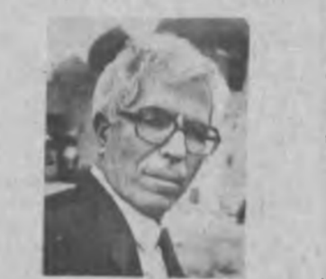
Авалло Туркияда барча тарикатлар яссавийлик билан ҳамбарчас болганлигини алоҳида таъкидламоқчиман. Ана дунё туркларининг Исромаънавий дунёсига юз буриб, унинг муқаддас ҳазиналаридан баҳраманд бўлишларида Яссавий таълимоти тенгсиз рол

Меҳмет ОИДИН, Измир университети профессори: