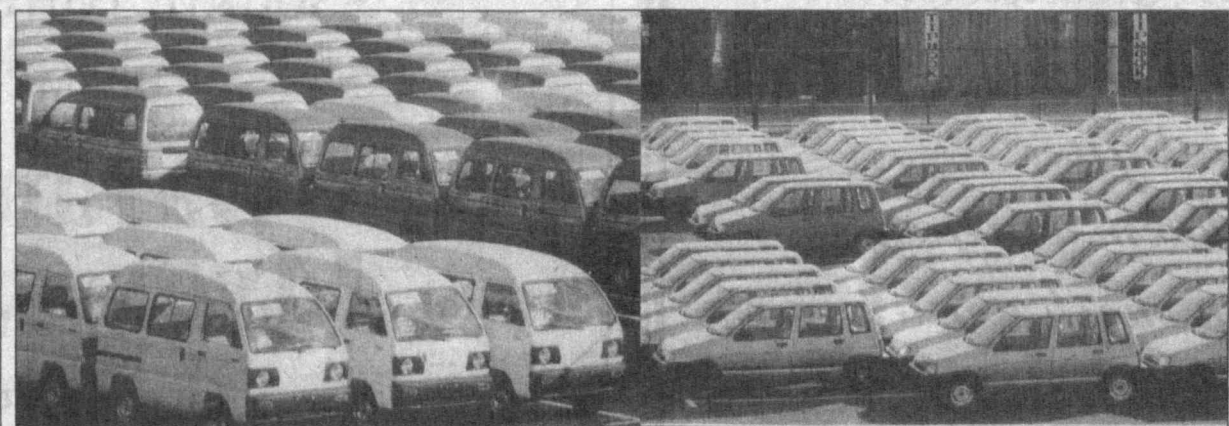
Ўзбекистон энгил автомобиллар тайёрловчи жаҳондаги 28 мамлакатдан бирига айланди.

Андижон бор-йўғи саккиз йилда шу қадар юксалган, тараққиётнинг ойдин йўлига чиқиб олган экан, бугун у ўзининг бутун бўй-бастини, ҳусни-жамолани, кўйинги, борлигини фахр ва ифтихор билан эл-юртга намойиш этмоқда.