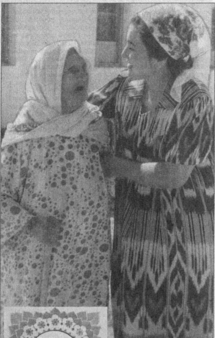
1999 йил — Аёллар йили