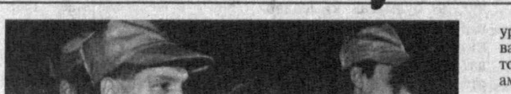
Ўзбекистон Республикаси Фавқулодда вазиятлар вазириликнинг бир гуруҳ кутқарувчилари Тошкент

Ўзбекистон Республикаси Фавқулодда вазиятлар вазириликнинг бир гуруҳ кутқарувчилари Тошкентға қайтиб келди. Улар Туркияда юз берган, турк халқи биниға оғир манаскактлардан оқиб келган элқалла халокатларини бағтираётганда иштирок этган эди.