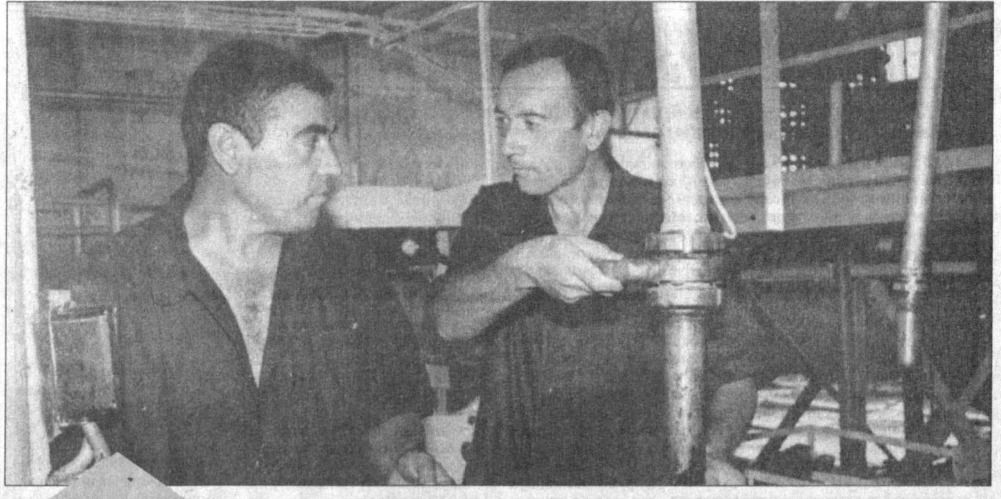
«Халқ сўзи» фуқаролар хизматида