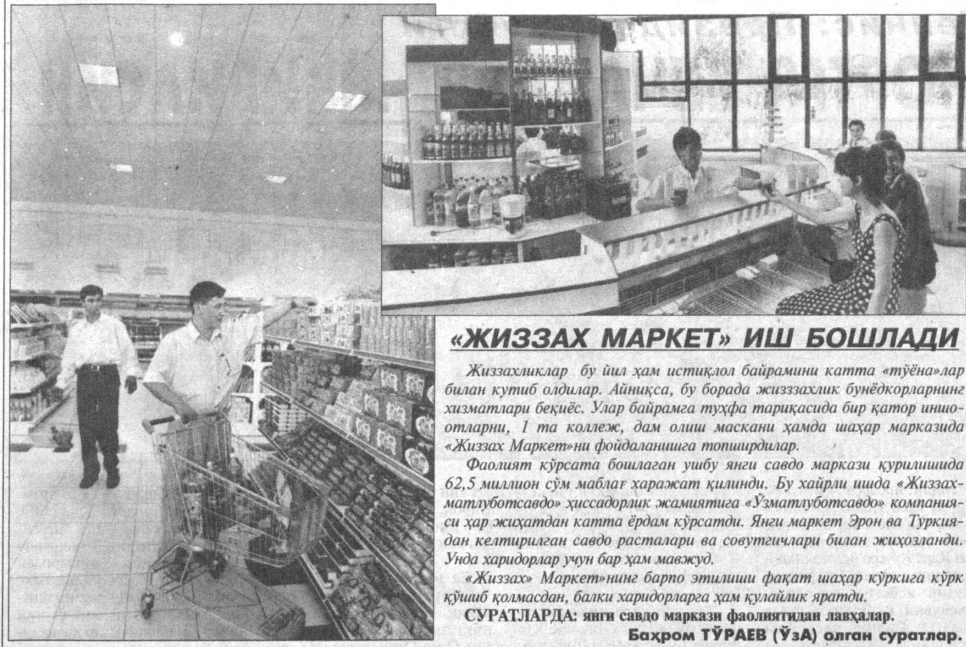
«ЖИЗЗАХ МАРКЕТ» ИШ БОШЛАДИ

Европа Иттифоқининг «Taxis Tempus» дастури асосида қиймати 52 минг долларлик замонавий техника воситалари Тошкент тўқимачилик ва энгил саноат институтига келтирилиб, ишлатила бошланди.