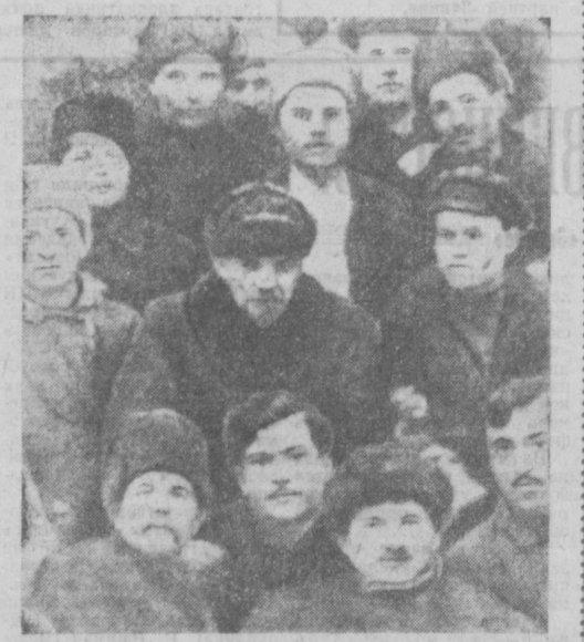
В. И. Ленин в группе делегатов II Всероссийского съезда горнорабочих в Кремле, январь 1921 г.