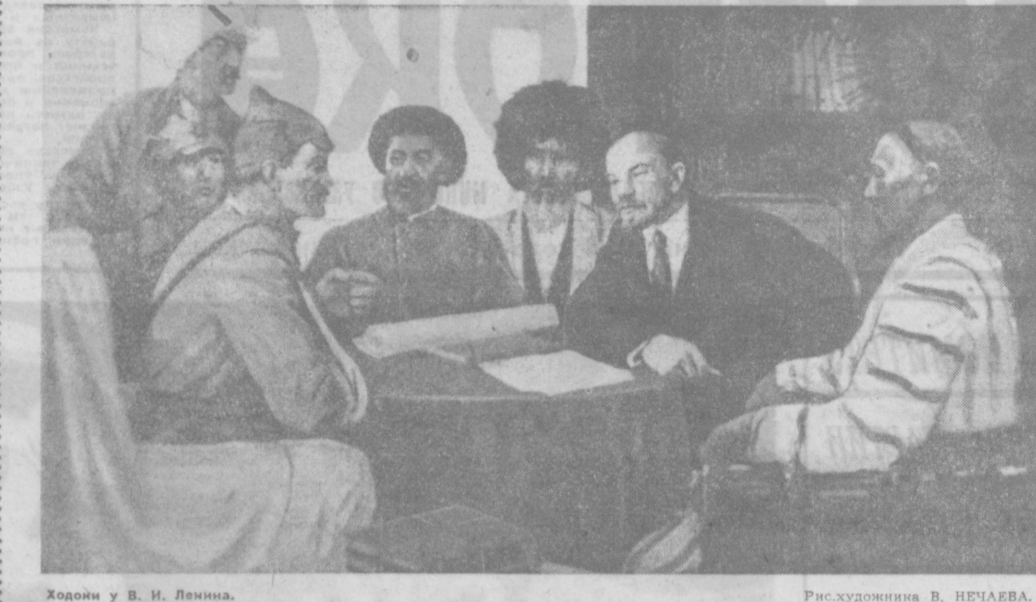
Ходяки у В. И. Ленина.