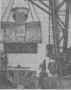
На Навоийской ГРЭС завершается монтаж очередного блока. С его пуском мощность станции достигнет 600 тысяч киловатт.