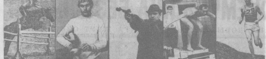
Конный спорт — 1.035 очков. Фехтование — 1.114 очков. Стрельба — 978 очков. Плавание — 652 очка. Бег — 916 очков.

БУХАРА, 15 июня. (По телефону от соб. корр.). В областном театре поставлены пьесы о современном. Среди них «Судья» — пьеса о судьбе человека, «Судья» — пьеса о судьбе человека, «Судья» — пьеса о судьбе человека.