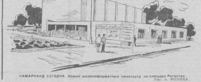
САМАРКАНД СЕГОДНЯ. Новый широкоформатный кинотеатр на площади Регистан. Рис. А. ФОМИНА.

Почему мы говорим об этом, о специфике обучения в Республиканской музыкальной школе-интернате