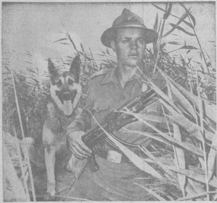
В любое время суток, в любую погоду несут свою ильготную службу воины в зеленых фуражках. Они всегда начеку. В их распоряжении все необходимое для бдительной и надежной охраны священных рубежей нашей Родины.