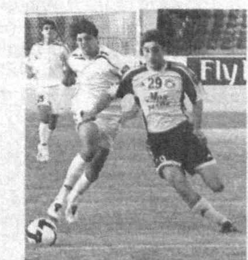
қарши (қолдирилган ўйин) ўтадиган жиддий баҳсга ҳозирлик қилишди.

"Хоразм" жамоаси ҳам ўз мухлисларини хурсанд қилишда давом этмоқда. Улар бу сафар Муборақда "Машъал" клуби устидан 1:2 ҳисобида зафар қўчишди.