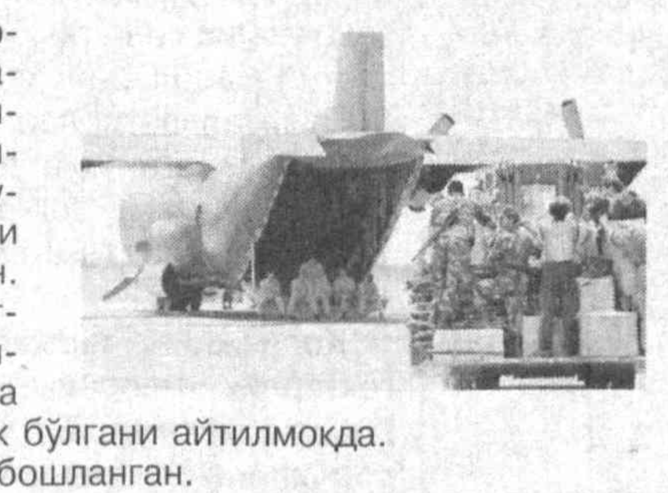
Воқеа юзасидан текширув ишлари бошланган.

Жакартадан парвозни амалга оширган мазкур ҳаво лайнери Ява оролларида фалокатга йўлқанди. Ҳозирча бунга нима сабаб бўлгани аниқ эмас.