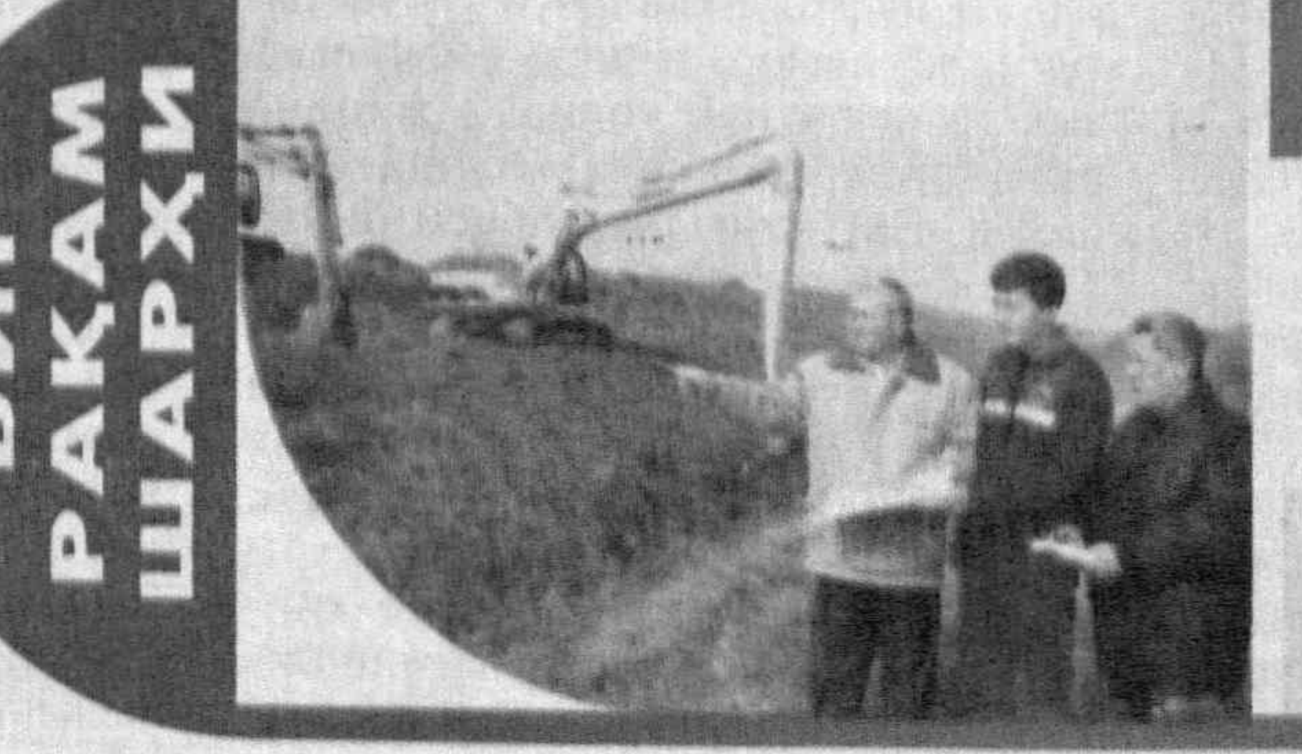
БИР РАҚАМ ШАРҲИ

Худудларда сугориладиган ерларнинг мелиоратив ҳолатини яхшилаш лойиҳаларининг изчил амалга оширилиши натижасида шундай кенг қўламли ишлар бажарилди.