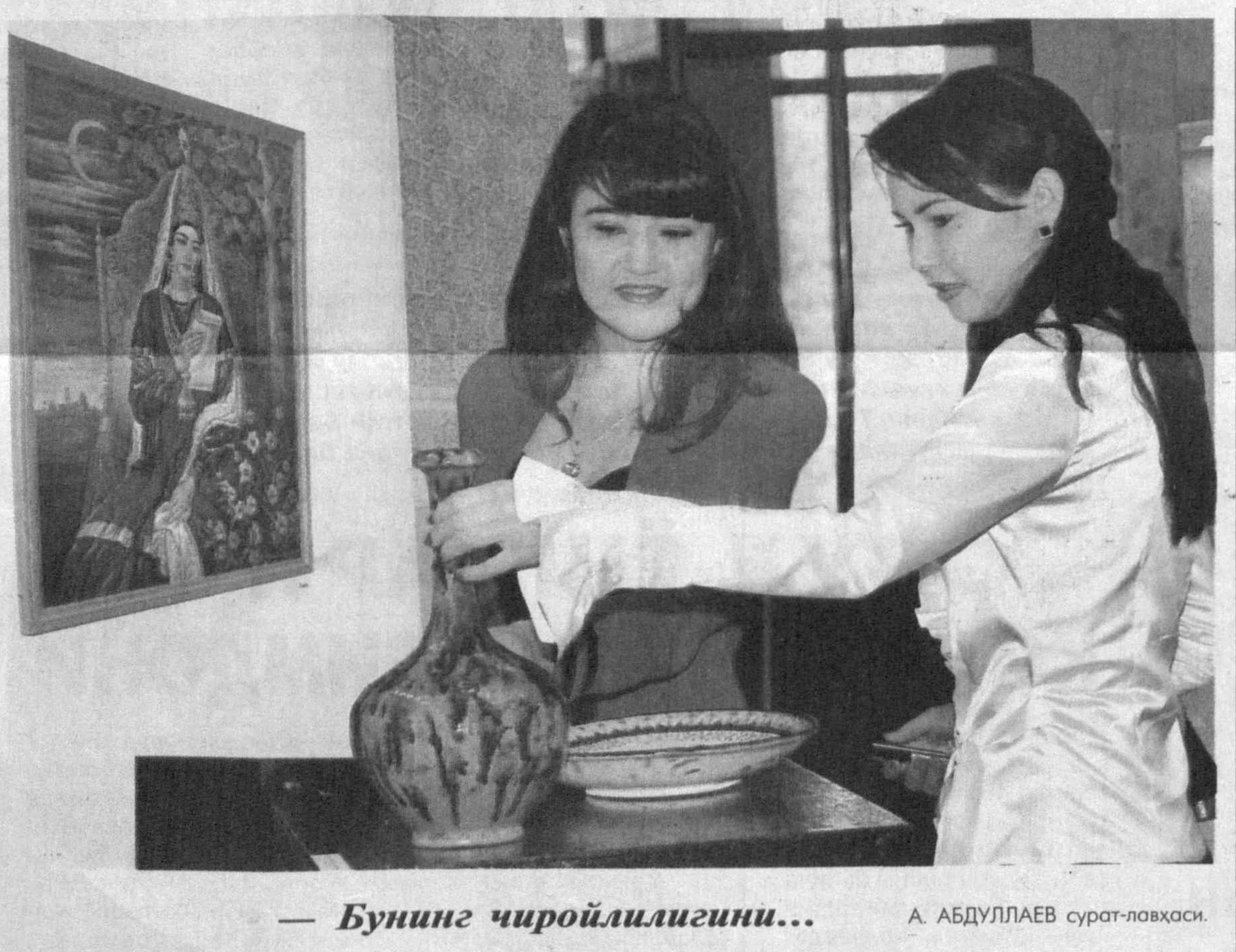
— Бунинг чиройлилигини... А. АБДУЛЛАЕВ сурат-ловҳаси.

Тожибой илгаридан ёнгил ишга ўрганган. Халфатуруш, сўнгра листадурӯшлик қилган. Сир эмаски, савдогарлик ҳалолликни ёқтиради. Харидорларнинг ҳақиға хиёнат қилмасангиз, чехрангизу қўнгиғиз очик бўлса, ишингиз ўз-ўзидан юришиб, даромадингизга барака инади. Тожибойчи, нафсига қўл бўлди.