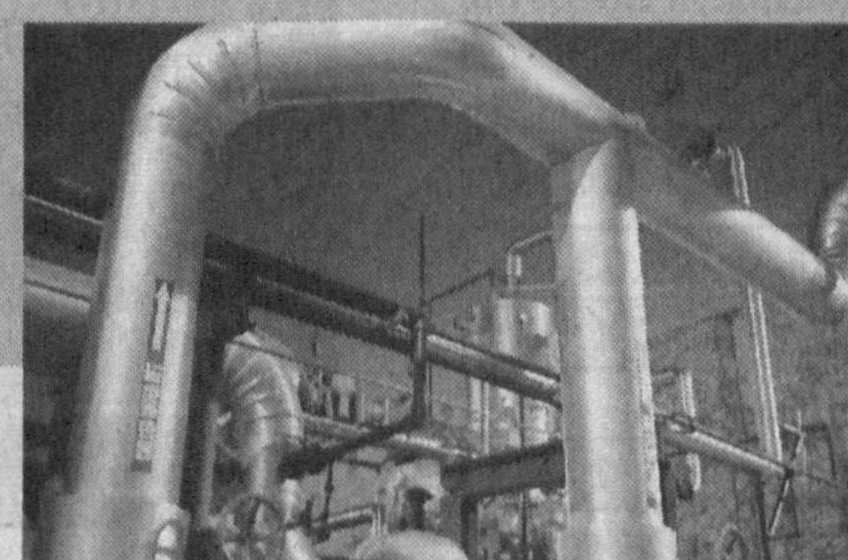
Магистрал газ қувурларидан фойдаланувчи корхона ва ташкилотлар манзиллари:

Қорақалпоғистон Республикаси, Тошкент, Сирдарё, Жиззах, Самарқанд, Фарғона, Наманган, Андижон, Қашқадарё, Сурхондарё, Навоий, Бухоро ва Хоразм вилоятлари ҳудуди бўйлаб шаҳарлар, аҳоли пунктлари ва sanoat корхоналарини табиий газ билан таъминловчи, юқори босимга эга магистрал газ қувурлари ётқизилганлигини эслатиб ўтади.