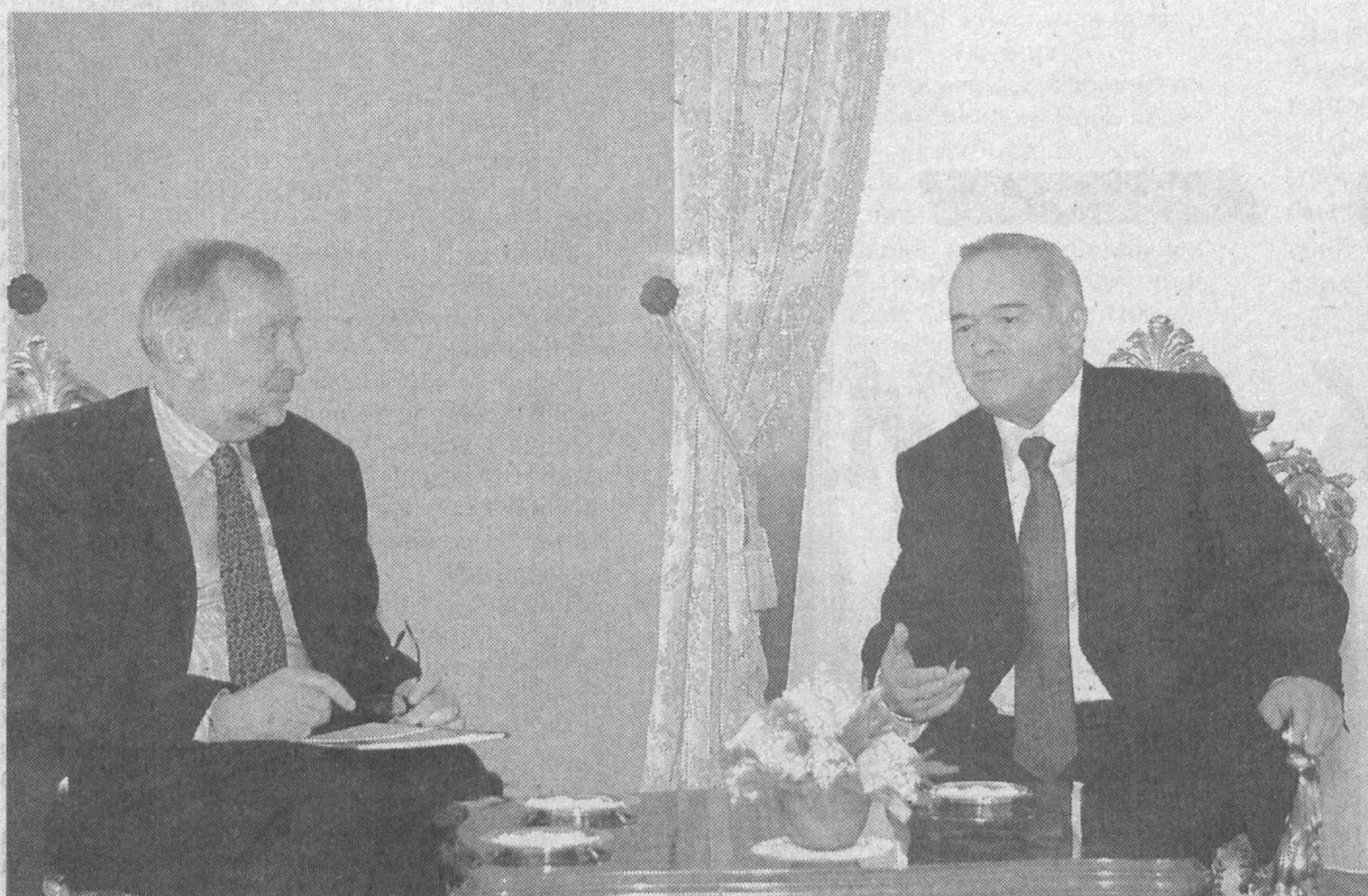
СУРАТДА: учрашув пайти.