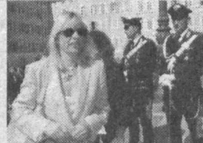
Хоржик матбуоти хабарлари асосида тайёрланди.

Сийасатчиларнинг таҳмин қилишича, унинг «Иттиҳодий муқобиллик» партияси сайловда ғалаба қозонса, Алессандре губернатор бўлиши ҳам мумкин.