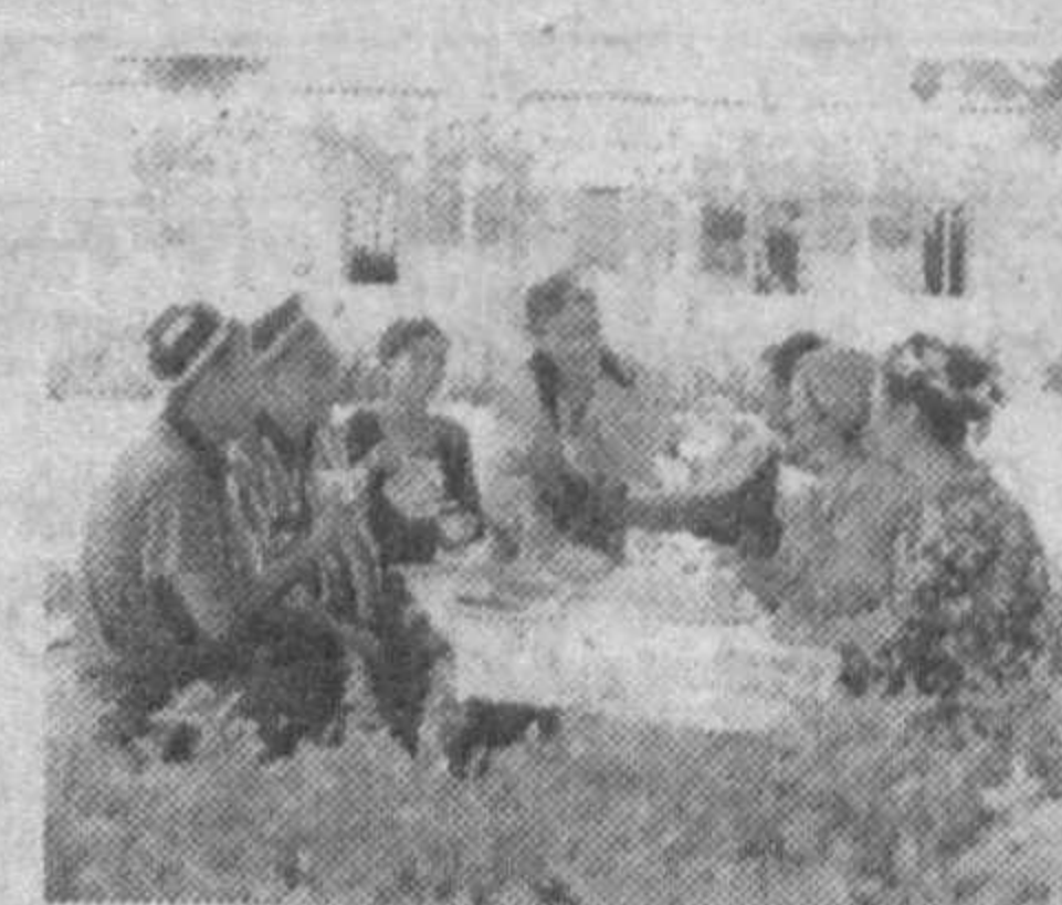
аёлларга нафи ҳақидаги тахминлар ҳали тиббиёт томонидан тўлиқ исботланмаган эди.

Кўк чойнинг инсонга фойдаси ҳақида кўп ва хўп айтилган. Бутун дунё гийёҳшунос олимлари ҳам бу ичимликнинг хислатларини чуқурроқ ўрганиш борасида турли тадқиқотлар олиб боришмоқда. Бугунги кунга келиб мутахассислар кўк чойнинг юзлаб фойдали жиҳатларини аниқлашган. Бироқ, унинг рақдан ҳимоя қилиши ва ҳомиладор аёлларга нафи ҳақидаги тахминлар ҳали тиббиёт томонидан тўлиқ исботланмаган эди.