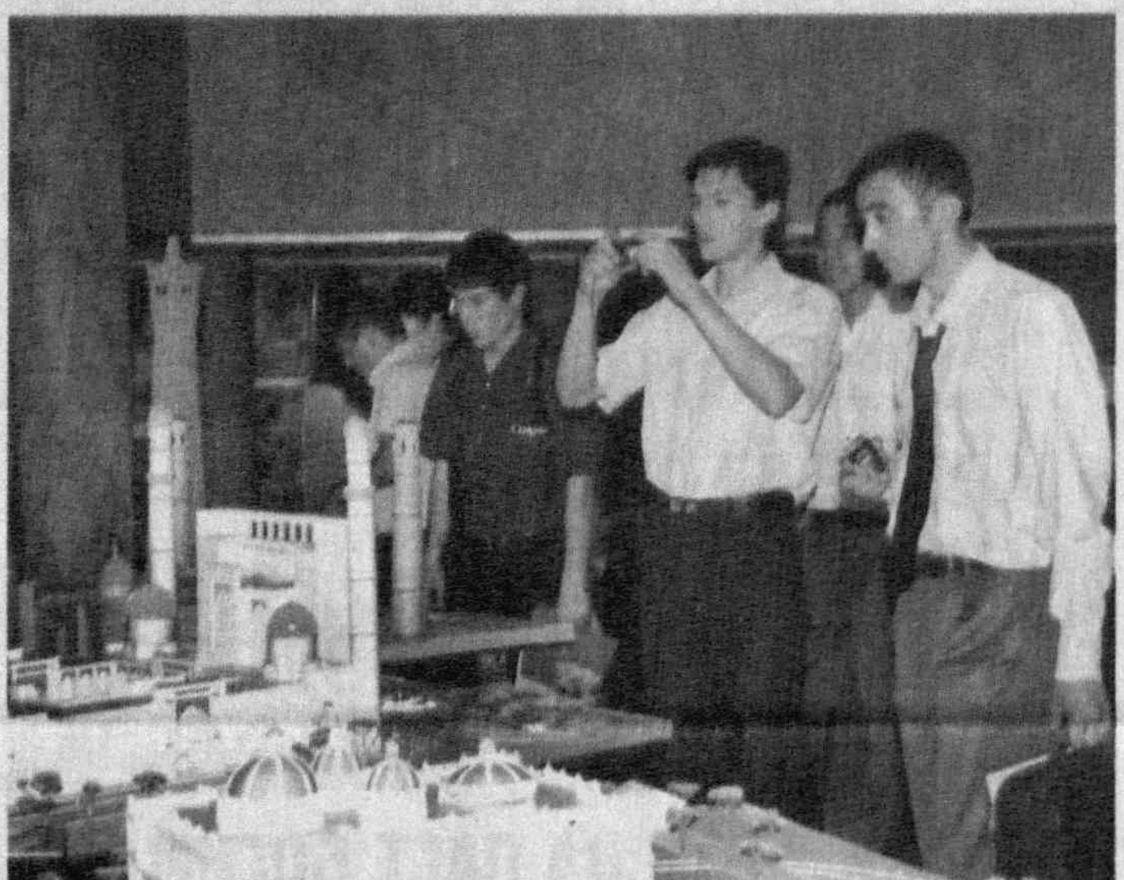
Ўзбекистон тарихи давлат музейида ёш иқдорларнинг "Меъмор — 2009" кўрик-танлови бўлиб ўтди.