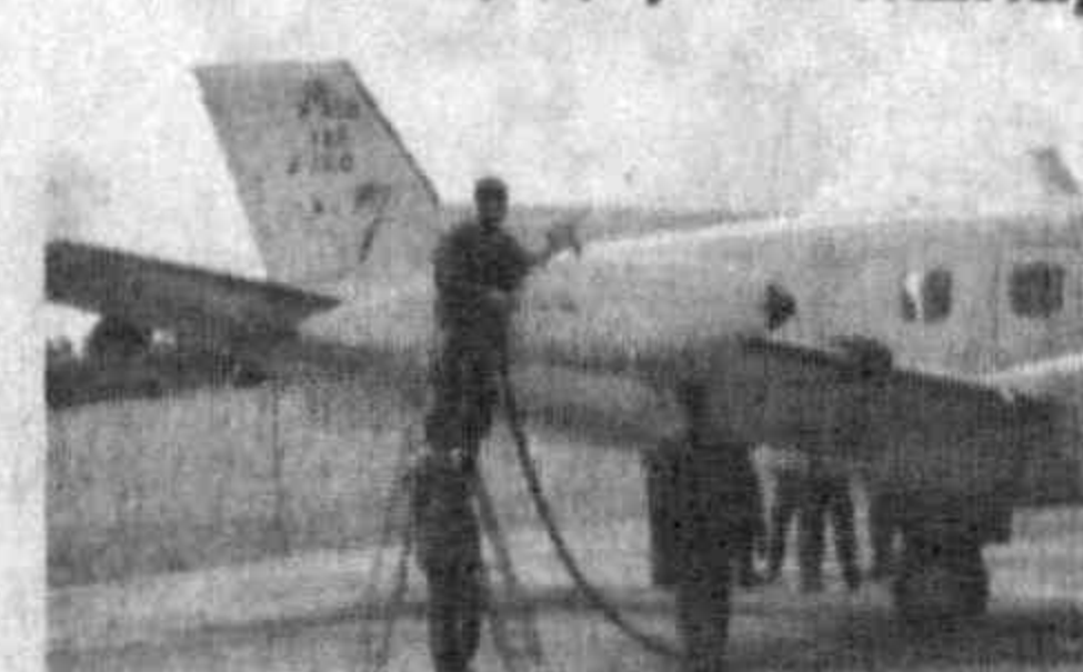
Ҳаво лайнери самога кўтарилганидан сўнг тўрт соат ўтган гоийб бўлган.

Бразилиянинг Рио-де-Жанейро шаҳридан парвозни амалга оширган ва Атлантика океани устида бедарак йўқолган, «Air France» (Франция) авиаконпаниясига қарашли «A330-200» йўловчи самолётини қидириш ишлари давом этмоқда.