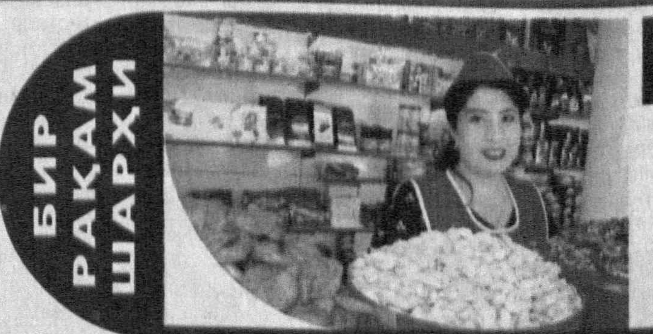
БИР РАКАМ ШАРХИ

Бугунги кундаги ўта долзарб муаммоларни ҳал этиш борасида бундай ҳўшёр ва ҳаққоний ёндашувлар халқаро жамоатчилик томонидан ижобий қабул қилиниши, шубҳасиздир.