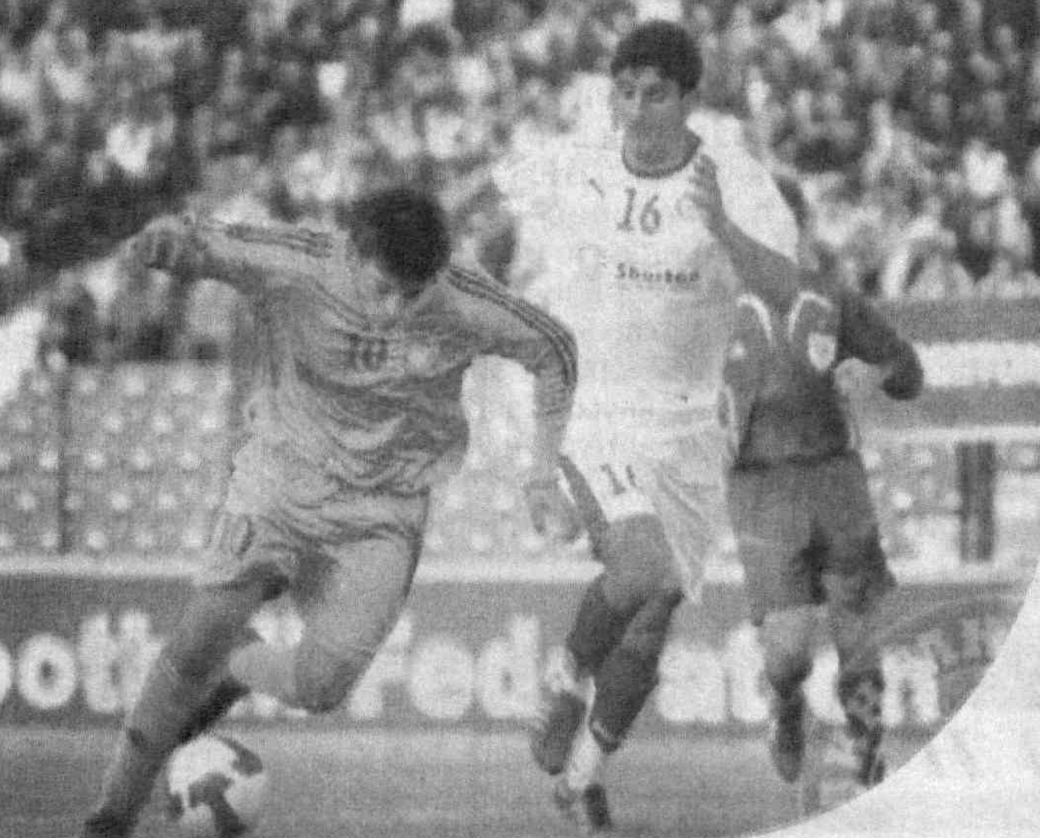
Ўтган дам олиш кунлари футбол бўйича Ўзбекистон XVIII миллий чемпионатининг 13-тур учрашувлари бўлиб ўтди.

ларга Хосе Луис Вильянуэва, Ривалдо (иккитадан), Сервер Жепаров ва Анвар Солиев муалифлик қилишди. Самарқандда чемпионат аутсайдерларидан бири — «Динамо» ва «Локомотив» жамоалари майдонга тушдилар. Шу кунги пойтахтликлар дарвозасини МДХда танилган Александр Филимонов химоя қилганга қарамай, йирик ҳисоб қайд этилди. Мезбонлар 5:0 ҳисобида за-