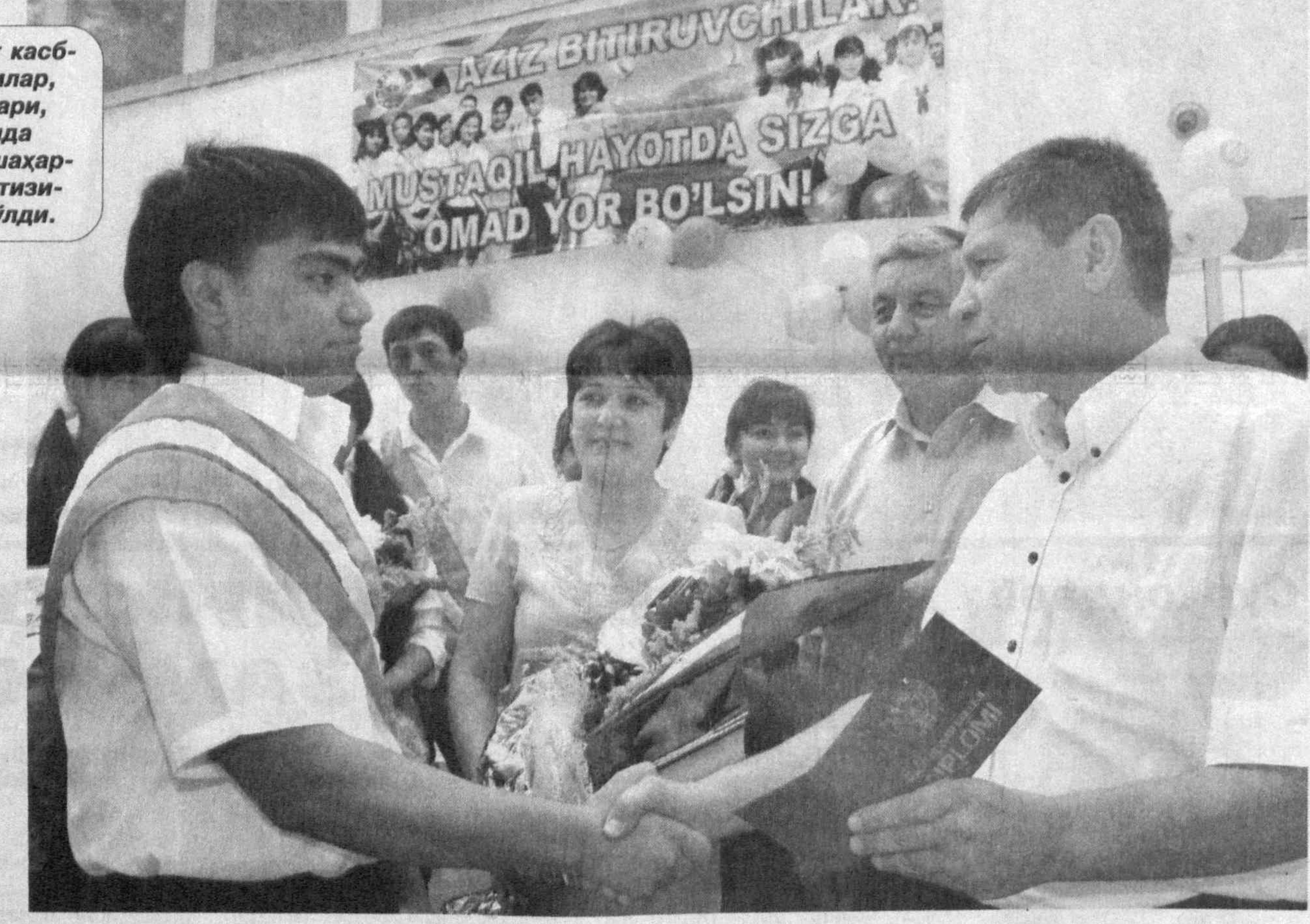
СУРАТДА: диплом топшириш маросимидан лавҳа.

Кеча Янгийўл технология-иктисодиёт касб-хўнар коллежи биноси нафақат ўқувчилар, балки ота-оналар, маҳалла оқсоқоллари, турли ташкилот ва муассасалар ҳамда "Камолот" ЕИХ вакиллари, вилоят ва шаҳардаги ўрта махсус касб-хўнар таълими тизимида дахлдор мутахассислар билан тўлди.