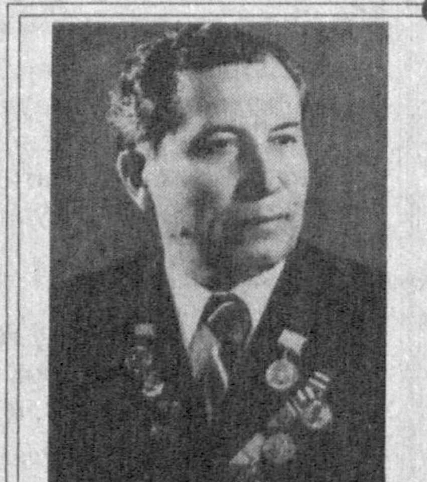
Одам умрини қандай узайтириш мумкин... Ўзбек жарроҳи, профессор Раҳим Мухамедов ҳозир ана шу мавзуда ҳам изланишлар олиб борапти

та синовалдан ўтиш даври бўлди. Унинг «Кекса ёшдаги беморларнинг касалликларини жарроҳлик йўли билан даволаш» мавзусидаги докторлик иши нафақат ёш олим ҳаётида, балки институт илмий жамоатчилигини ўртасида ҳам катта воқеа бўлди. Кўп ўтмай уни умумийжарроҳлик кафедрасига мудар қилиб тайинлашди. 1970 йилда профессор унвони... Кейин ўн йил давомида институт ўқув ишлари бўйича проректорлик... Ёшларга билим бериш, ама-