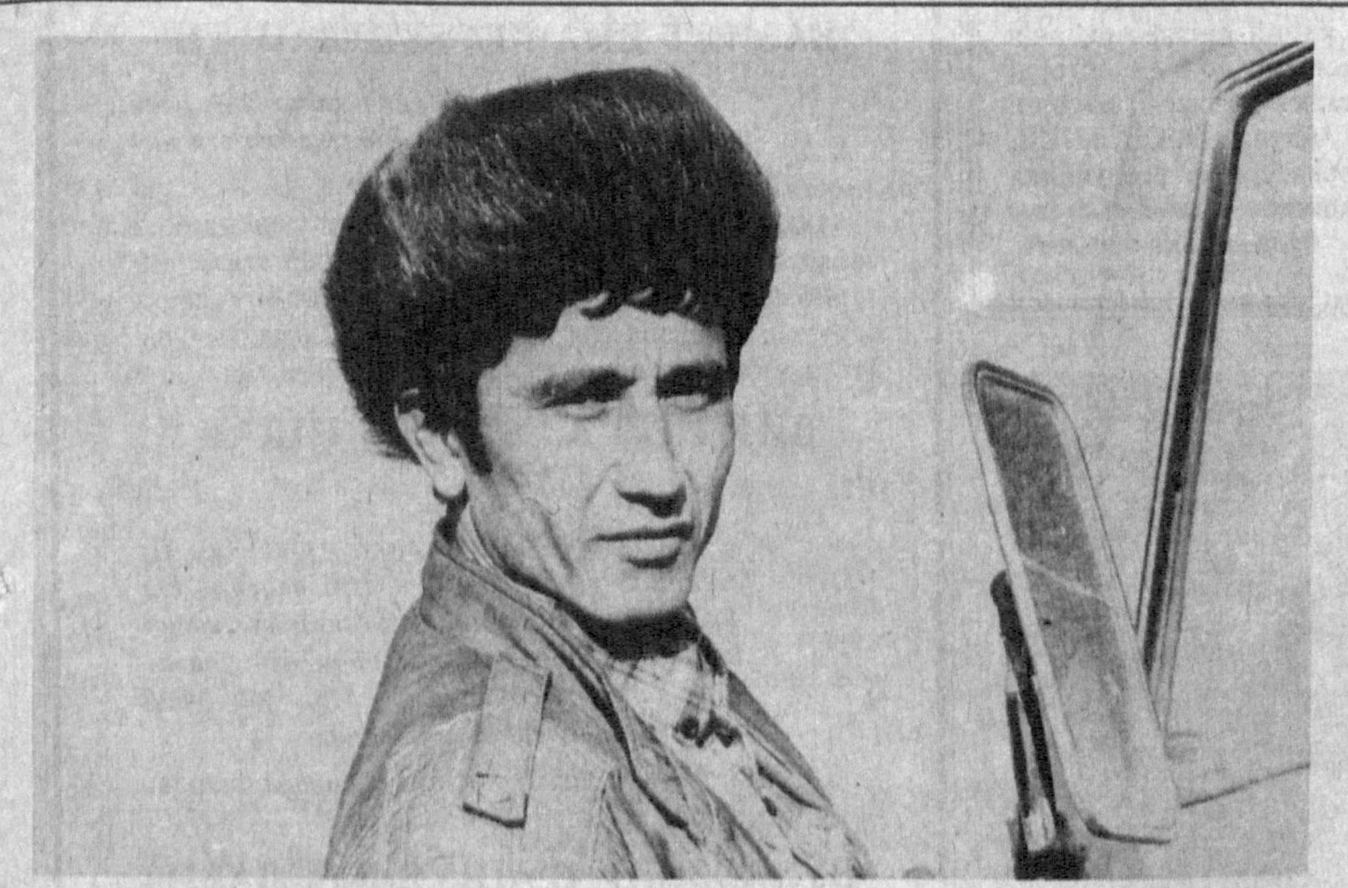
Самарқанд вилояти. «Ўзбекхонмаҳсул» ишлаб чиқариш корхонасининг Нарпай туманидаги 407-маҳсул курялиш колоннаси ташкил этилганга ҳадемай 20 йил тўлади. Уттан қисқа давр ичиде колонна курувчилари вилоятнинг дөври барча туманларида ободончилик ишларини амалга ошириб, ичимлик сув тармоқлари, оқова ишоотларини куриш каби кўплаб бунёдкорлик ишларини бажардилар. Айнаи пайтда колонна цехида

Хитойлик ҳамкорлар билан бунёд этилган қўшма корхонанинг дастлабки маҳсулотлари пиллакорларга тарқатилди.