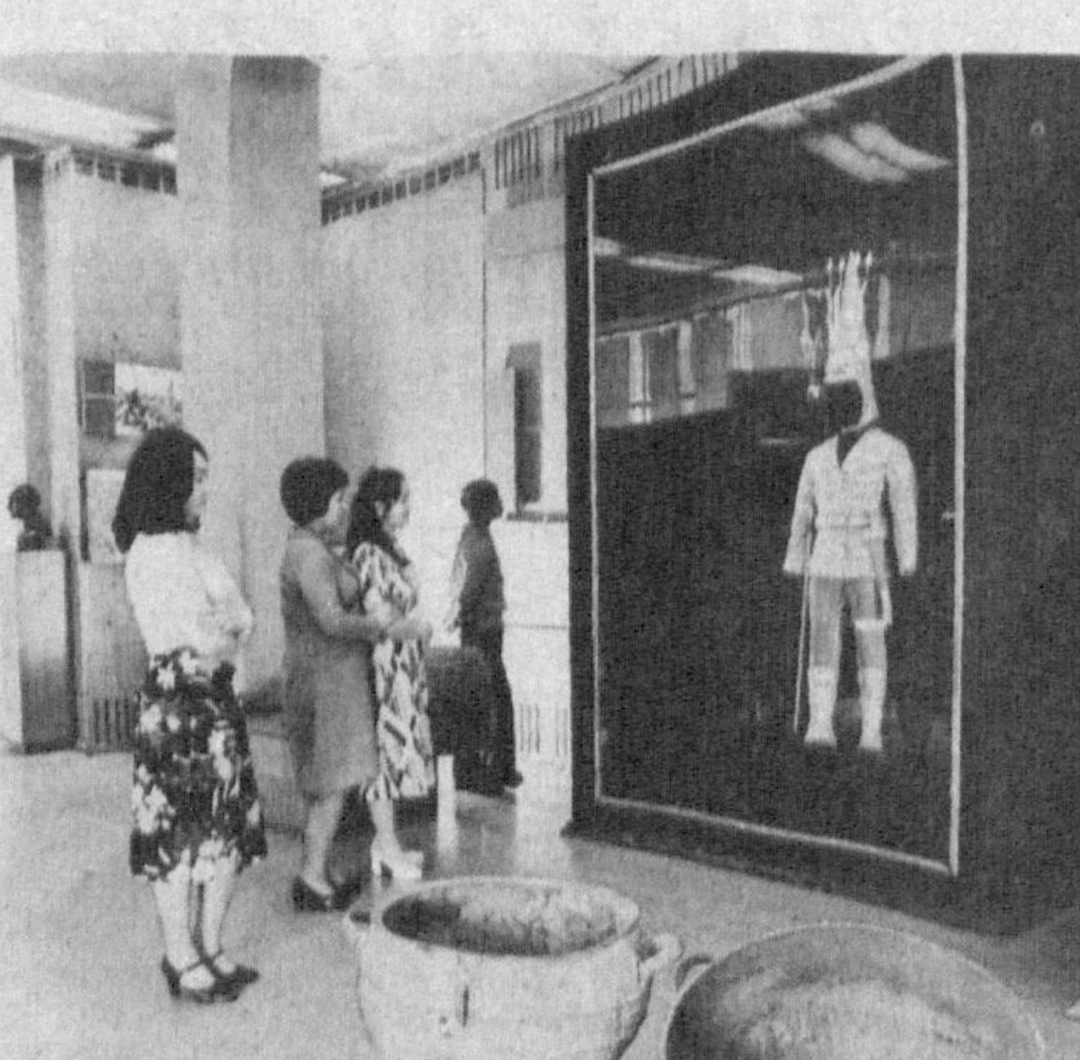
Козогистон археология музейида қўйилган антик аждодлар кийими томошабинлар эътиборини тортапти.

14 кишидан иборат бу тезкор гуруҳ БМТнинг чеченistonлик қочқинларга инсонпарварлик ёрдами кўрсатиш бўйича тузилган уч ойлик дастурини амалга оширишда кўмак беради. Дастур бўйича 160 минг чеченistonлик қочқинга инсонпарварлик ёрдами кўрсатиш кўзда тутилган.