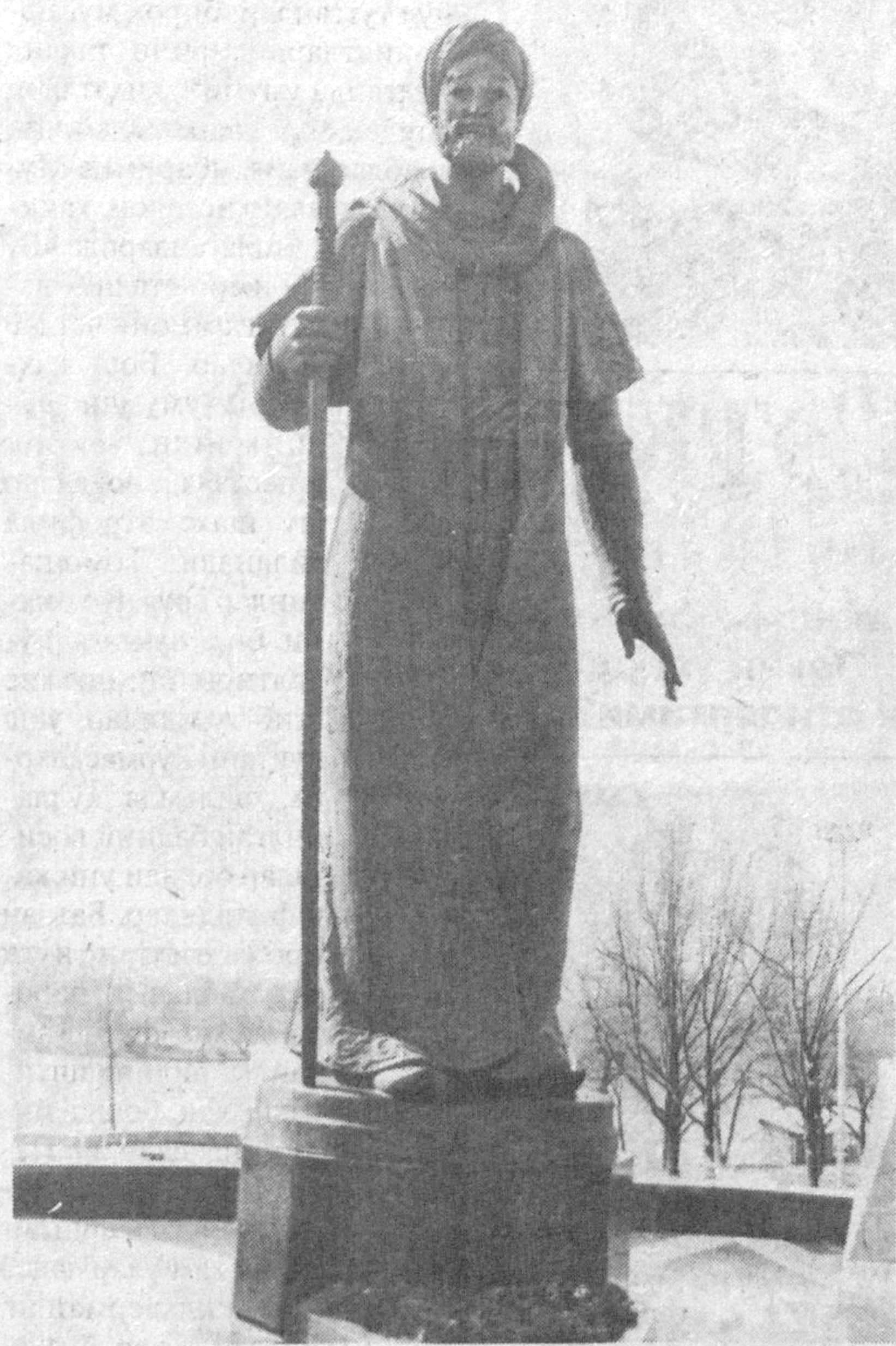
Учун уни улуг шоирнинг сўнги насабномаси деб аташа ҳам бўлади. Уни Навоийнинг бой ҳаётини тажрибасидан, кузатишларидан келиб чиқиб яратган ва бунга асар бошида алоҳида таъкидлаб кўрсатган. Бу асарнинг қиммати аввало шулардадир. Қолаверса, бу бошқа ашбулар ва шоирларнинг насрий панднома-ларига жавоб ҳам эди.

Алжи шараф узра офтоб Уди ҳаё; Бўстони саодатқа саҳоб* Уди ҳаё. Мазмун хасонга ҳижоб Уди ҳаё** Эл айнига*** гўёки ниқоб Уди ҳаё.