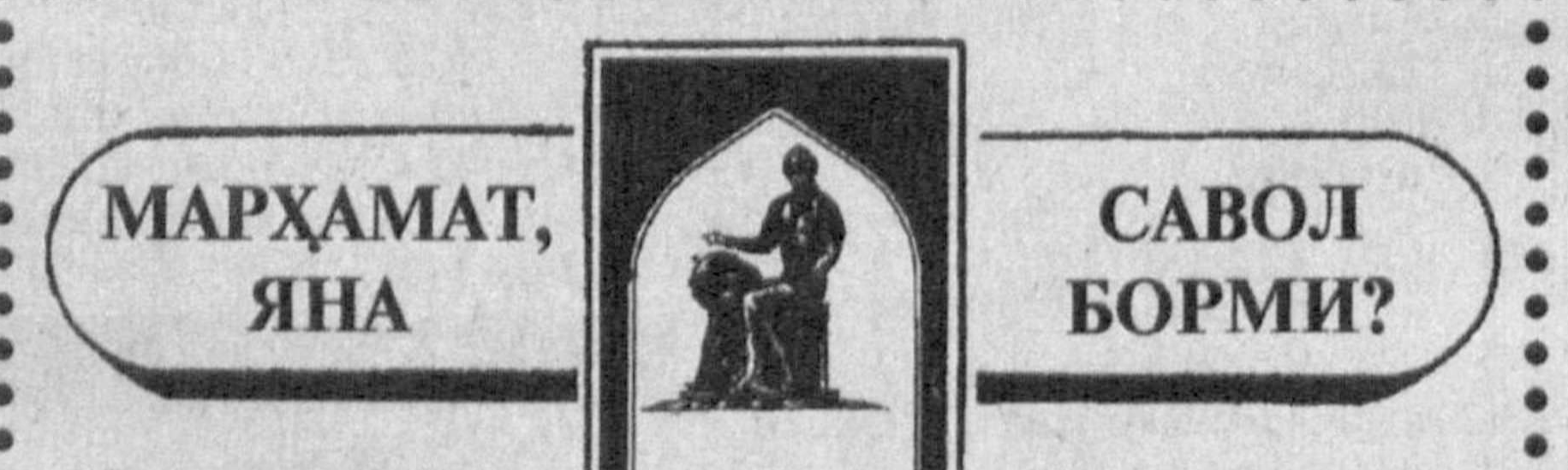
МАРҲАМАТ, ЯНА САВОЛ БОРМИ?

Республика Гидрометеорология маркази хабар қилади: Ҳафтанинг бошида республика-камиз худудида совуқ қиш ҳавоси ҳукм суради. Ҳаво ҳарорати кўпгина вилоятларда кечалари — 5-10 даража совуқ, кундузи — 1+14 даража ўртасида, шимолда кечалари — 11-16, кундуз кунлари 0-5 даража совуқ бўлади. Кейинчалик ҳаво ҳарорати аста-секин кўтарилишни кутулади. Ҳафтанинг биринчи ярмида ёғингарчилик деярли бўлмайди. Бу даврда кечаси ва эртаб туман тушадди. Ҳафтанинг иккинчи ярмида эса баъзи туманларда ёғимр ёғади.