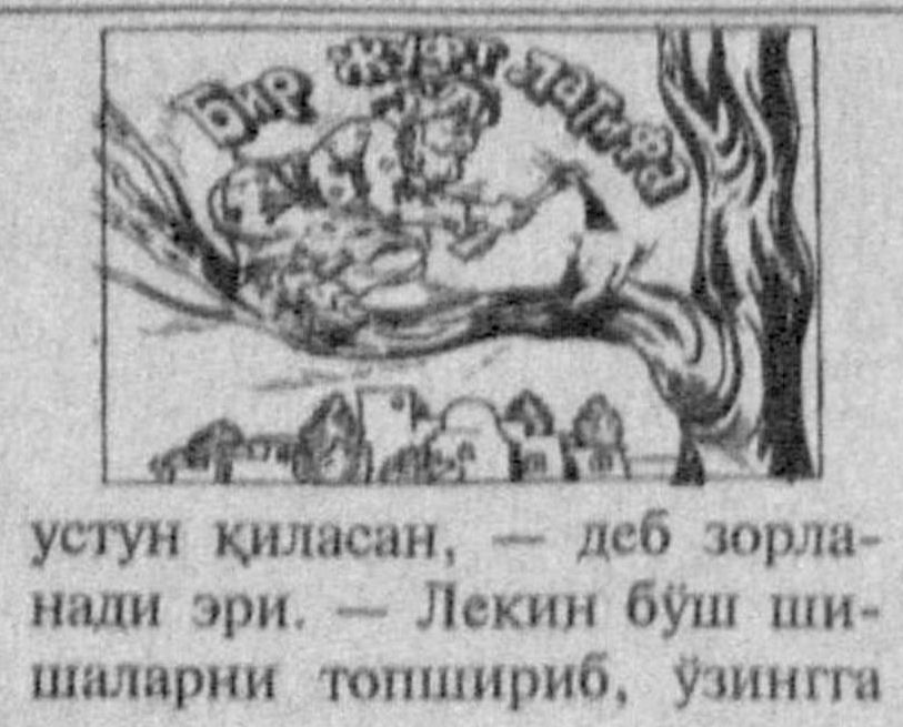
устун қиласан, — деб зорланади эри. — Лекин буш ишларини топшириб, ўзингга

— Ҳайронман, — дейди эр телефонда гаплашган эзма хотинига, — нечүк бор-йўғи йигирма минутага гапни тутата қолдинг? Нима бўлди сенга? — Номерни нотўғри терибман. *** Бир жуфт пиво харид қилсам бас, жанжал қилиб оламни остин-