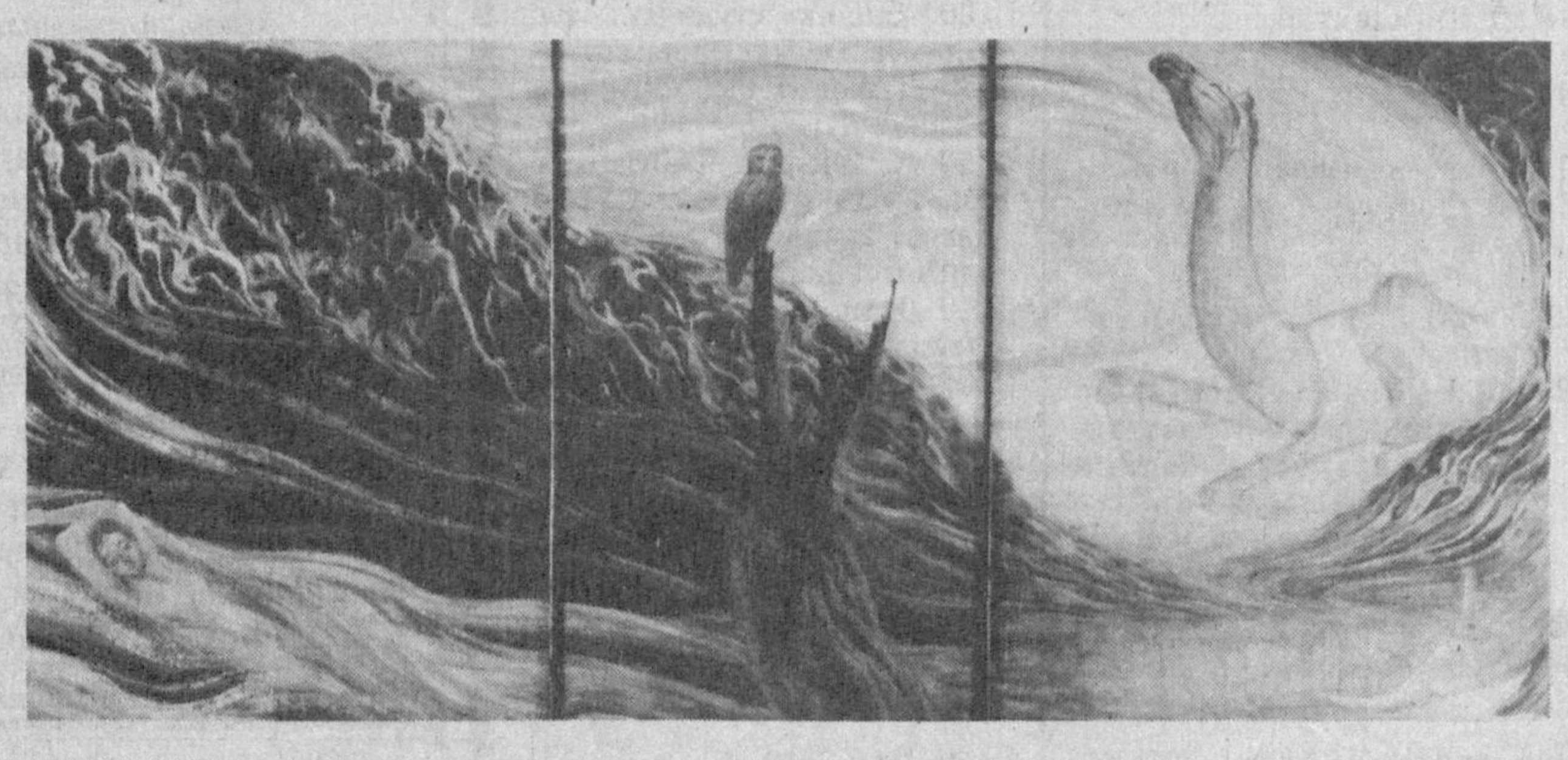
Москвадаги Третьяков галереясида жой олган. Англия-Беньков номли бадий билим қолгандик, тасодифан. — Айтинчи, Рол Мейлс —

• Ҳикматлар хазинасидан ЯХШИЛИК ҚИЛГАН ЯХШИЛИК КЎРАДИ Кемада сайҳатга чиққан икки дўст денгизга тушиб кўрдилар. Шу вақт тўлақон кучайиб кетди. Йўлочилар ҳаммаси бақириб-чақира бошладилар. Кема даргаси дарҳол ўзини денгизга ташлаб, улардан бирини қутқариб қолди. Бошқасини қутқаришга эса унчалик жон койитмади. Иккинчиси чўкиб кетди. У ердагиларнинг барчаси дарғага: — агар тезроқ ҳаракат қилганимизда иккинчи одамни ҳам қутқарсанг бўларди. Жуда иммилладинг, — дедилар. Дарға бундай жавоб берди: — Менга яхшилаб қулоқ солинг. Бу йигитни қутқаришни хоҳлаган эдим, қутқардим. Чунки у менга аввалдан яхшилиқ қилиб келган. Бошқасининг чўкиб кетишини хоҳлаган эдим, у чўкиб кетди. Чунки унинг кўп ёмонлигини кўрганман. У мени ранжитган, кўнглимни оғритган. Алқисса: бу дунё шундай — қилмишинга яраша экан, зарра яхшилиқ қилган унинг ширин мевасини тотади. Заррача ёмонлик қилган ҳам унинг жазосини олади. Ақлли одамлар ҳеч кимга зарар етказмайдилар. Шу сабабдан ҳам барча яхшиларга ёндашдилар.