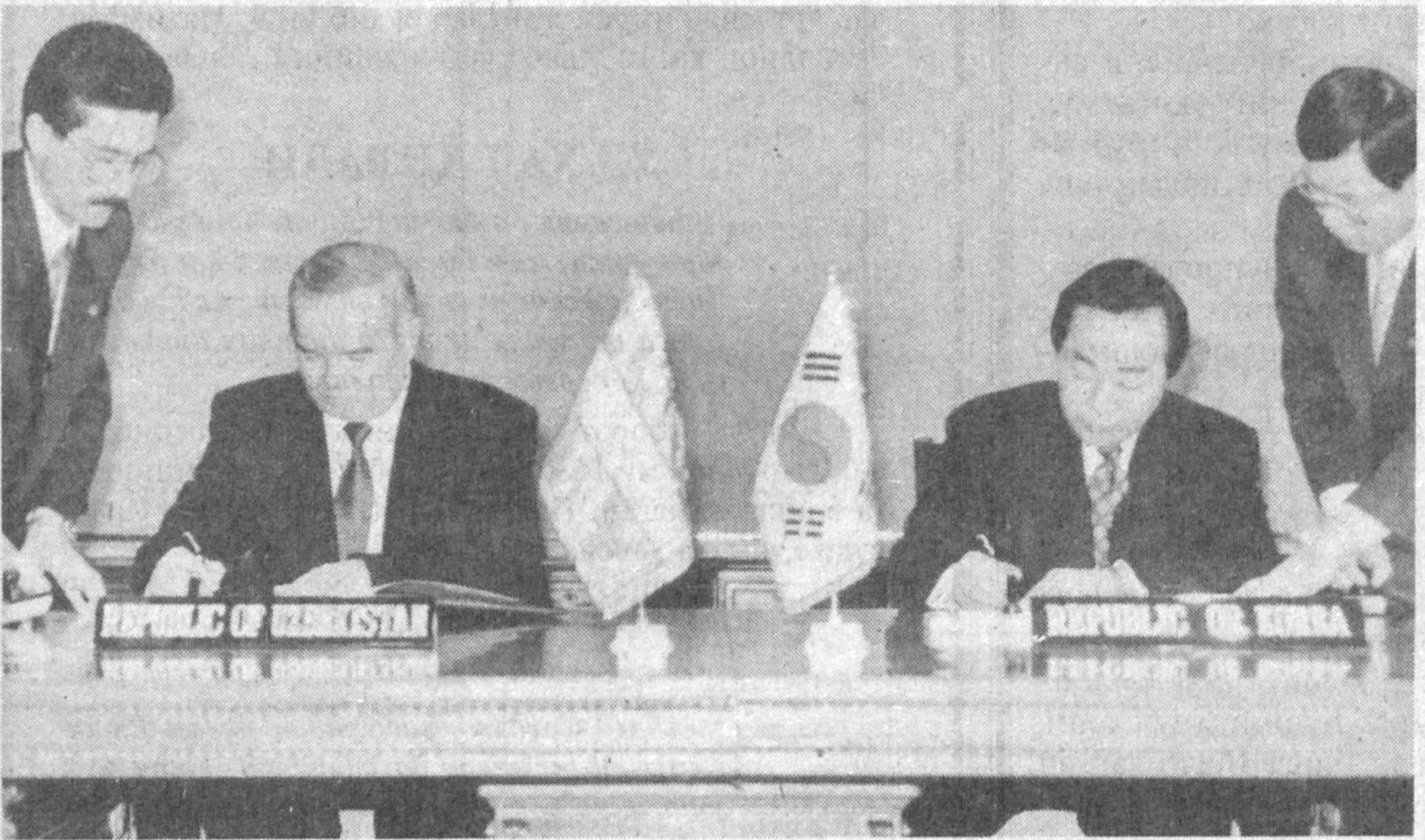
Ҳужжатларни имзолаш пайти.

ЎЗБЕКИСТОН ПРЕЗИДЕНТИ ИСЛОМ КАРИМОВНИНГ КОРЕЯ РЕСПУБЛИКАСИГА ТАШРИФИ ЯКУНЛАРИГА ДОИР