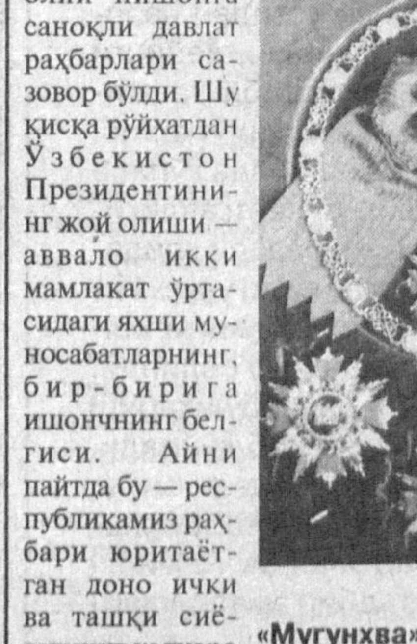
«Мугунхва» катта ордени.

— Утган йили Ўзбекистонда бўлганимда, — деди Корея Президенти Ким Ен Сам, — мамлакатингизда бошқичма-бошқич амалга оширилаётган демократиялаштириш ва иқтисодий ислохотлар жараёни менда чуқур таассурот қолдирди. Шу боис мен мамлакатларимиз ўртасида муттасил ривожланиётган ўзаро ҳамкорлик муносабатларини ҳам астойдил қузатиб бораёяман. Утган кунда муздай ишларда жасалтай амалга оширилди.