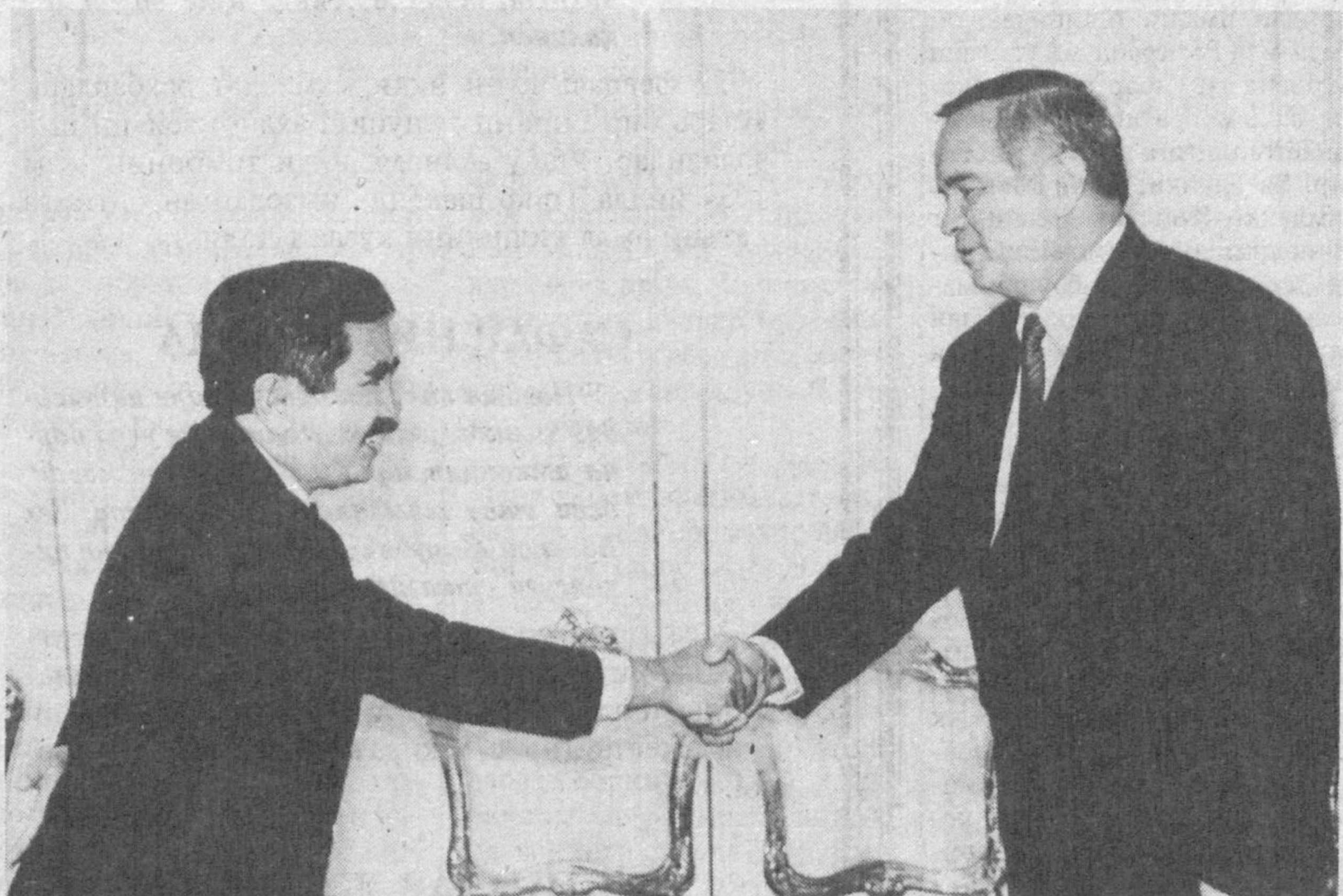
Ўзбекистон Президенти Ислам Каримов 7 март кuni Индонезия Республикасининг мамлакатимиздаги Фаху- ллодда ва Мухтор элчиси Хасан Абдужаллилни унинг илти- мосига кўра қабул қилди.

Ислам Каримов мамла- катимиз билан Индонезия ўр- тасидаги алоқалар ривожлан- иб бораётганидан мамну- нийат изҳор этди. 1992 йил Индонезияга расмий ташри- ф чоғида имзоланган ҳуж- жатлар ўзаро алоқаларни кенгайтириш учун асос бў- либ хизмат қилаётганини, мамлакатларимиз ўртасида-