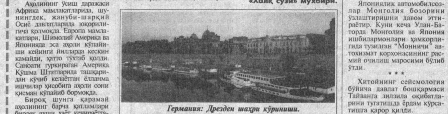
Германия: Дрезден шаҳри кўриниши.

Кейинги пайтларда дунёнинг турли мамлакатларида табиий офатлар, фожиаелар, террорчилик ҳаракатлари, қуролли тўқнашувлар рўй бермоқда. Буларнинг оқибатида қанчалик-қанча одамлар бошпанасиз қолиб, сарсон-сарғардон бўлмоқда, минглаб кишилар ҳаётдан бевақт бўлиб қолмоқда. Лекин шунга қарамай ҳаёт давом этапти. Бу фожиаелар, ҳузурликларга босма-бос туғилиш, янгилаш, ривожланиш бир умр тўхтамайди. Дунё аҳолисининг сони табири ортиб бормоқда. Бугунга келиб, ер юзиде истиқомат қиладиган одамлар сони 6 миллиардга етди, яъни 1960 йилдан буён дунё аҳолиси ролпа-рос яқин ҳиссага қўйилди.