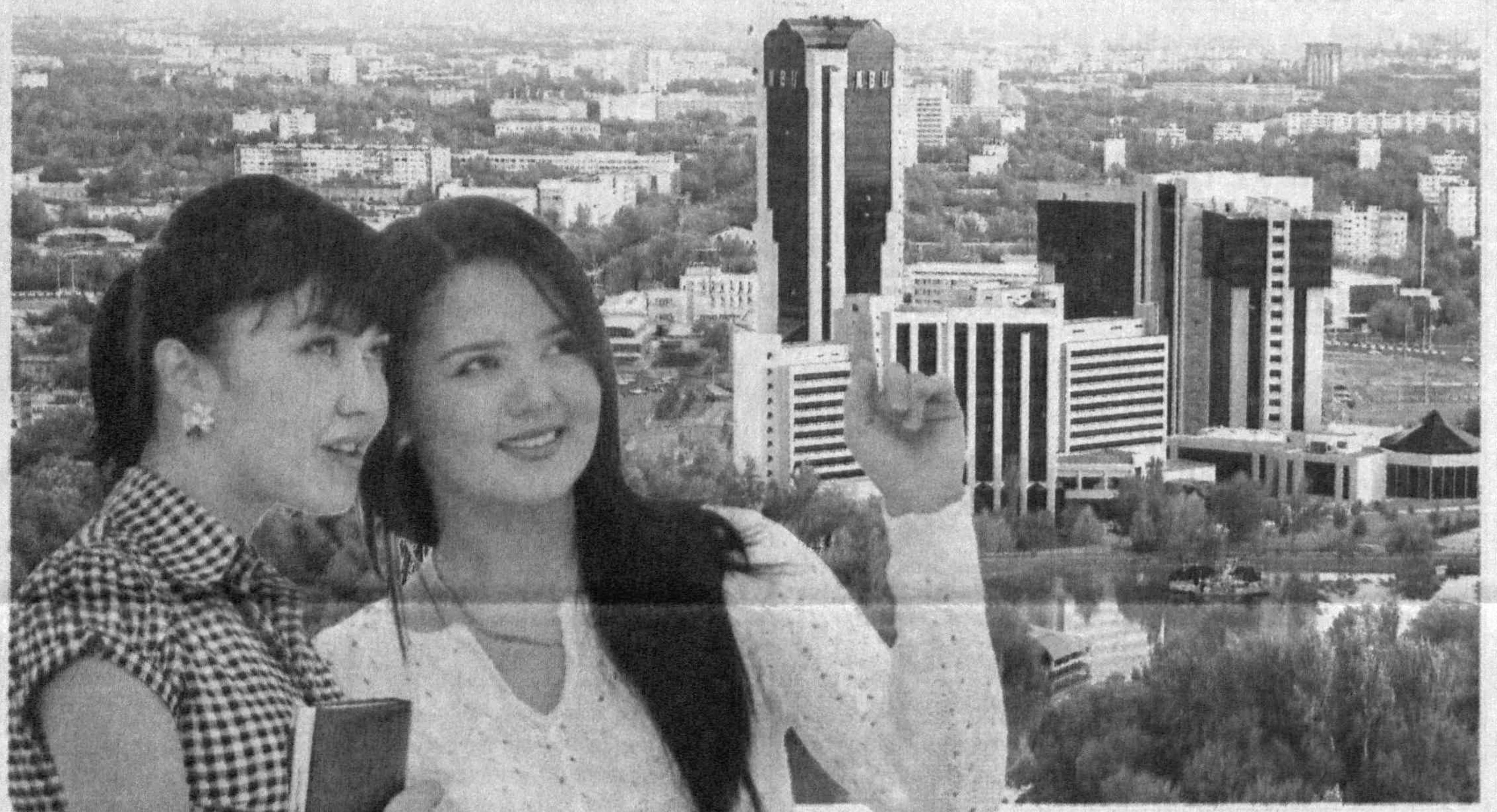
Шаҳримиз гўзал-а, дугонажон!..