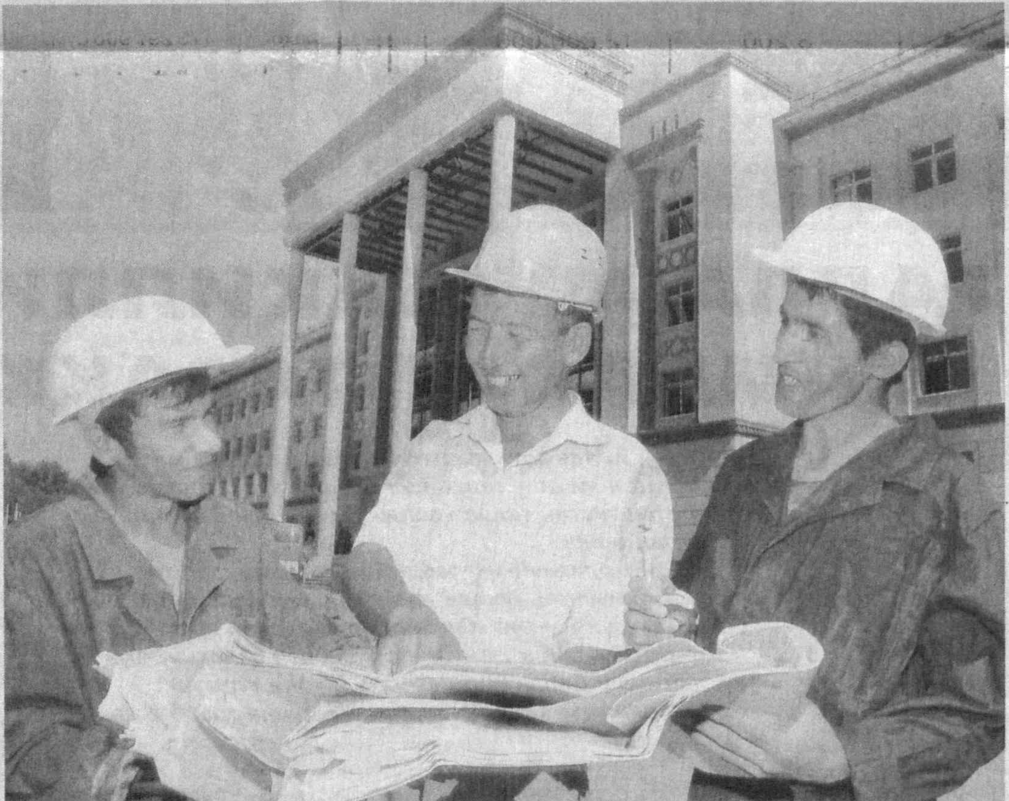
Янги ўқув йилини янги бинода бошлайдиган талаба ёшларга қурувчилар яна бир тўхфа ҳозирламоқдалар. Байрам арафасида университетнинг 365 ўринли ётоқхонаси ҳам мукамал таъмирланиб, фойдаланишга топширилди. Гўлбахор ТАҢГИРОВА.

Айни пайтда университетнинг тўрт қаватли янги ўқув биноси қўриб битказилмоқда. Лоийҳавий қиймати 8,3 миллиард сўмдан зиёд ушбу муқташам бино 1400 ўринга мўлжалланган бўлиб, унда замонавий техника воситалари билан