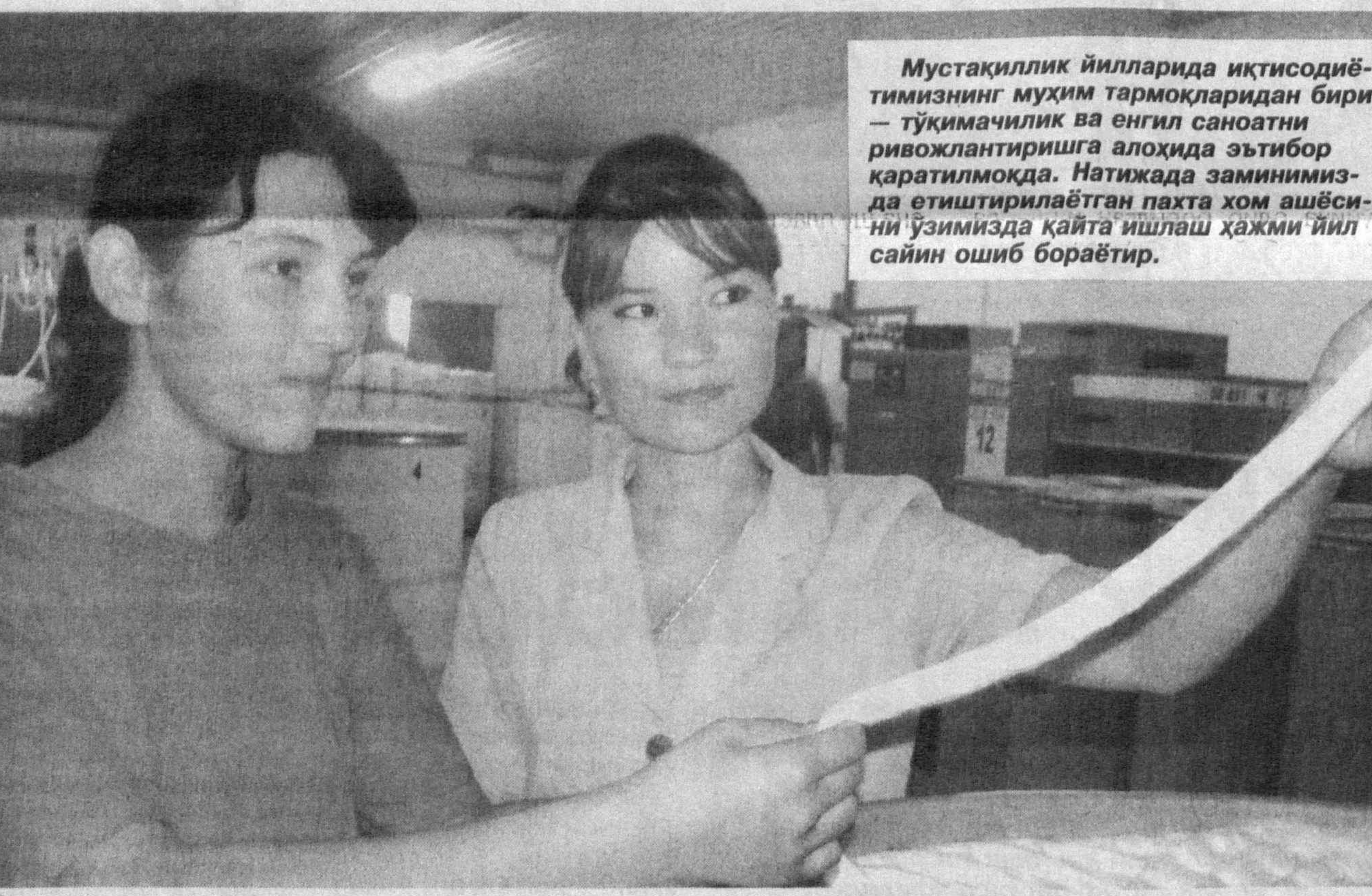
Мустақиллик йилларида иқтисодиётимизнинг муҳим тармоқларида бири — тўқимачилик ва энгил сановатни ривожлантиришга алоҳида эътибор қаратилмоқда. Натijaда заминимизда етиштирилаётган пахта ҳам ашёсини ўзимизда қайта ишлаш ҳажми йил сайин ошиб бораётир.

Мамлакатимизда, айниқса, хориқ инвесторлар учун қулай шарт-шароитлар яратиб берилгани ти-