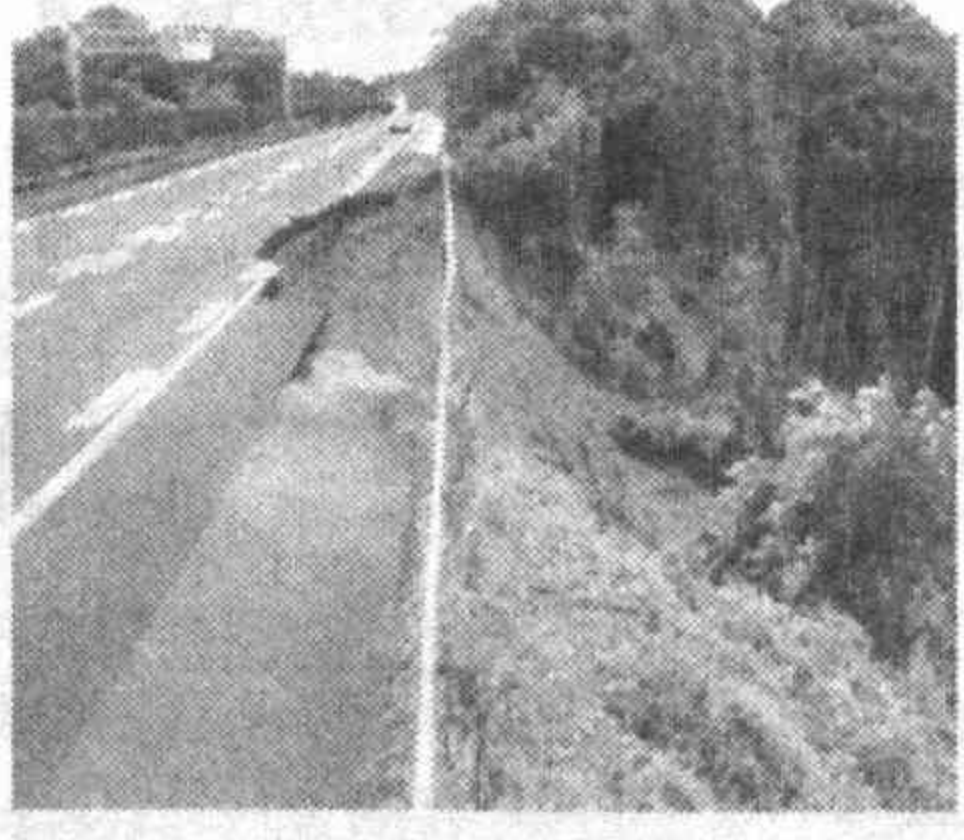
зуока префектурасида юз берган зилзила оқибатида бир киши ҳалок бўлган, 100 дан зиёд одам шикастланган.

Ер силкинишининг кучи Рихтер шкаласи бўйича 6,7 баллга тенг бўлган ва унинг маркази Тинч океанида қайд этилган. Ҳозирча қурбонлар ва жароҳатланганлар ҳақида маълумотлар йўқ. Гувоҳларнинг сўзларига кўра, зилзила цунами содир бўлишига олиб келмаган.