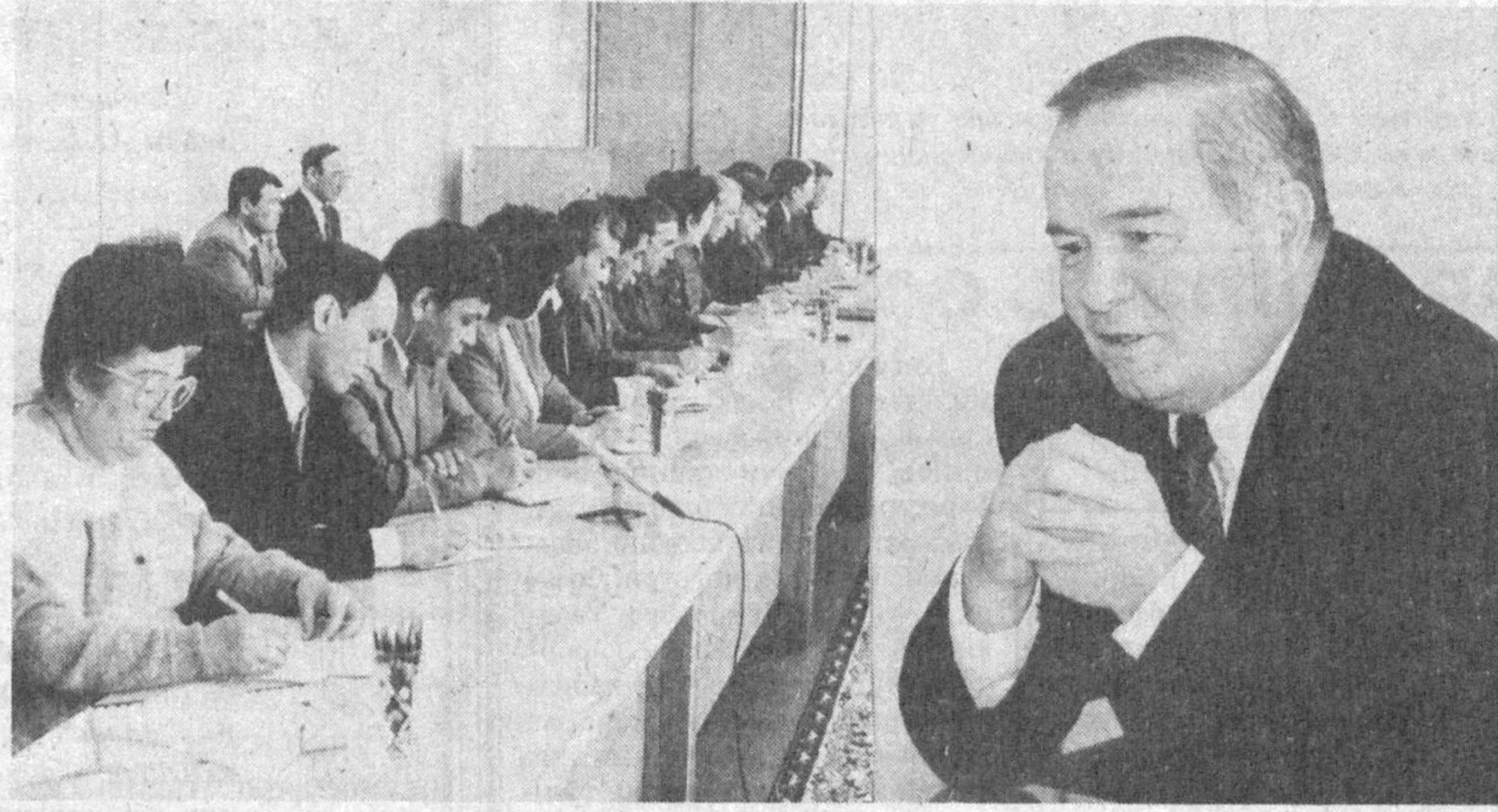
СУРАТДА: учрашув пайти.

Республика Президенти Ислам Каримов 16 март кuni Ўзбекистон Касаба уюшмалари фаолларининг бир гуруҳини қабул қилди. Давлатимиз раҳбари уларни, улар сиймосида барча меҳнаткашларни тарихий воқеа — мамлакатимиз касабаси уюшмаларининг 70 йиллик тўйи билан муборакбод этди.