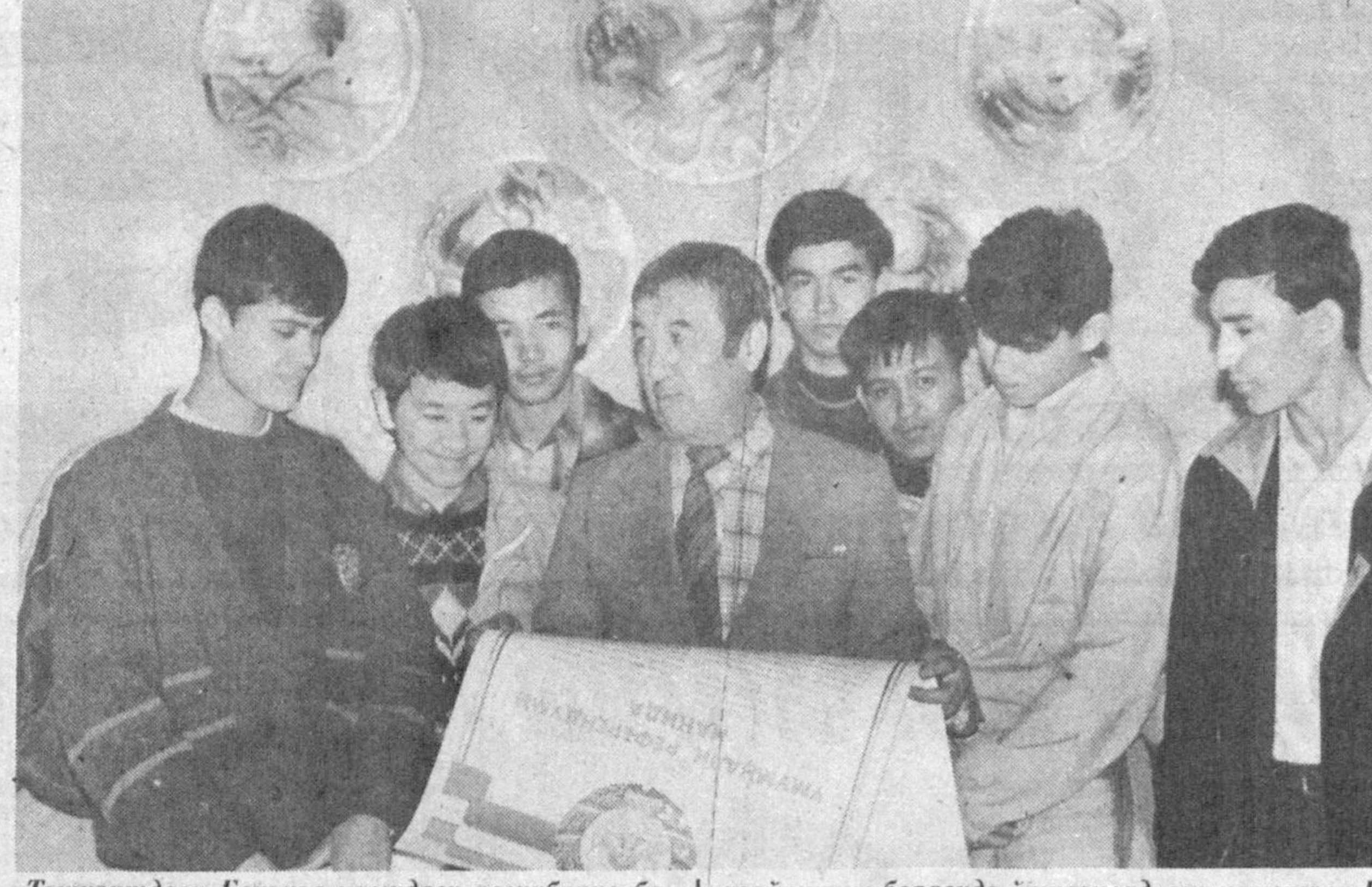
Тошкентдаги Бельков номидаги республика бадий билим юрти ўқитувчи ва талабалари Ўзбекистон Президентини ваколатини 2000-йилгача узайтириш борасида ўтказиладиган умумхалқ Референдумга қизғин тайёргарлик кўришяпти.