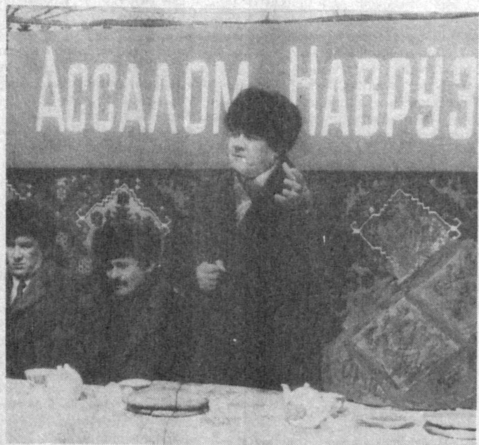
Қадимий ва навқирон Урганч шаҳрида ҳам Наврўз байрами жуда катта шоду хуррамлик билан нишонланади. Шаҳар ҳокимлиги ташаббуси билан барча қорхона ва ташкилотларда, ўқув юртларида, маҳаллаларда халқимизнинг улуг айёми меҳр-шафқат, эзгулик ва яхшилик шори остида ўтди.