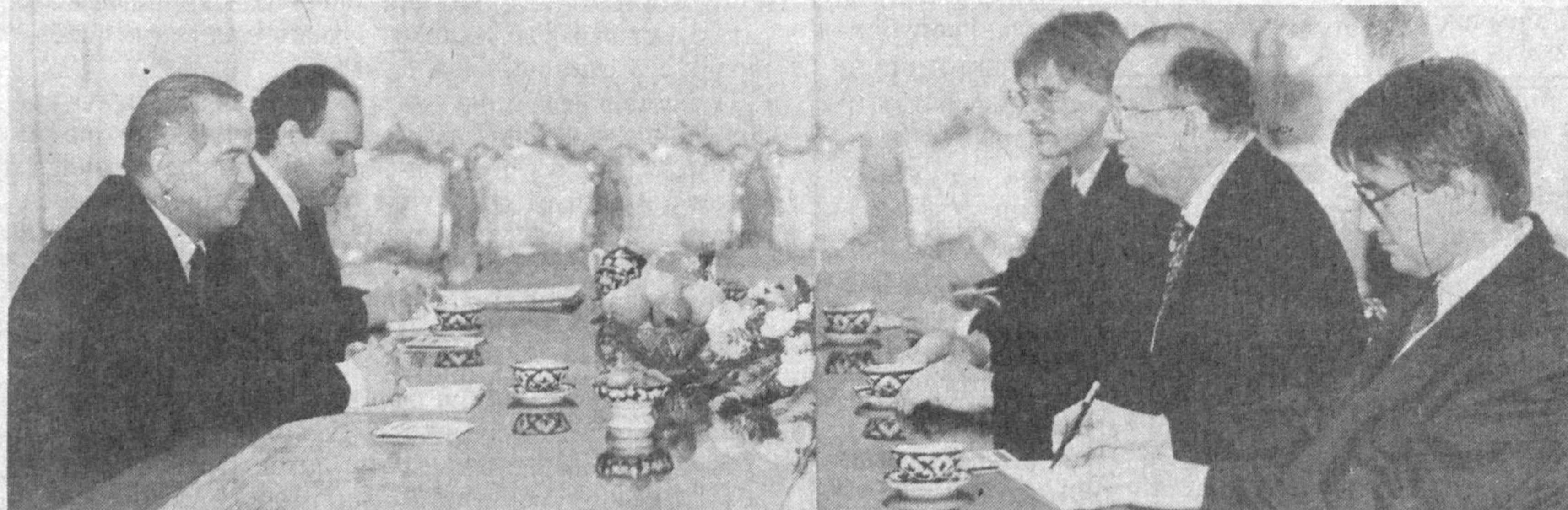
СУРАТДА: қабул пайти.