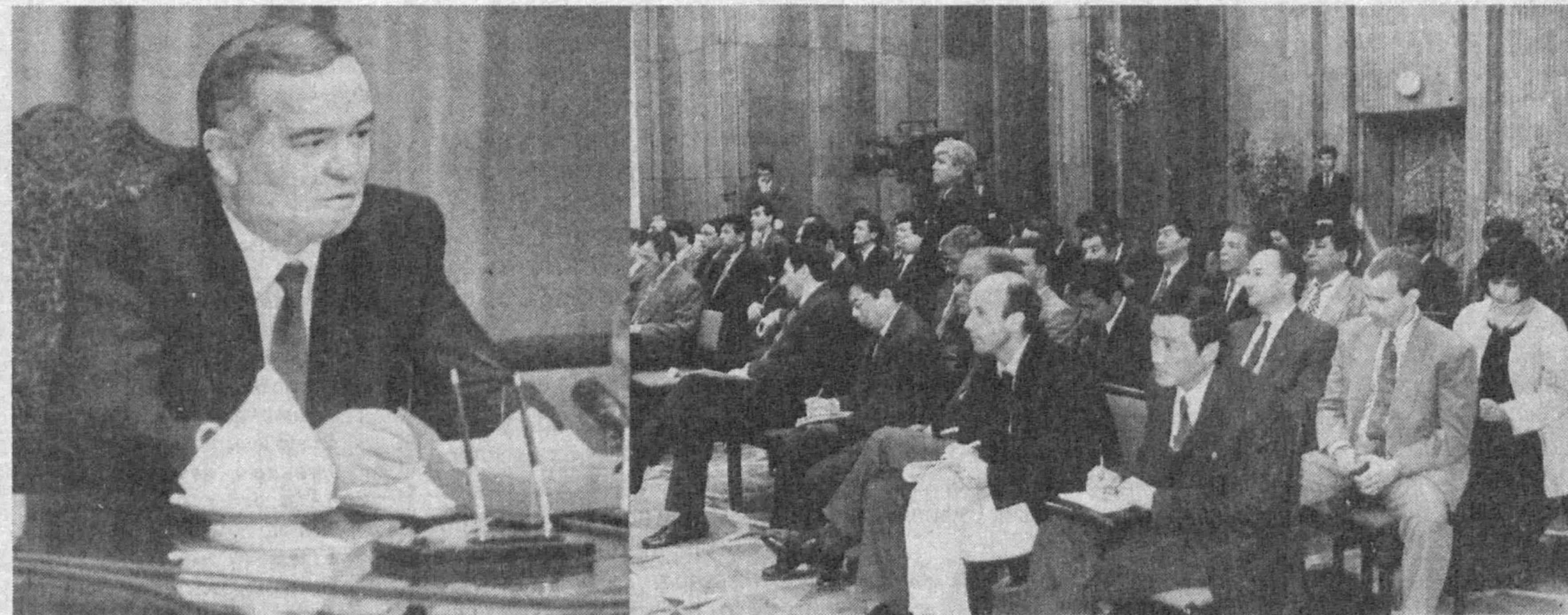
СУРАТЛАРДА: матбуот конференцияси пайтида.

Ўзбекистон Республикаси Президенти Ислам Каримов 29 март куни Тошкентда Ўзбекистондаги дипломатия корпуси ва халқаро ташкилотлар вакиллари, республика ва хорижий оммавий ахборот воситалари ходимлари билан учрашди.