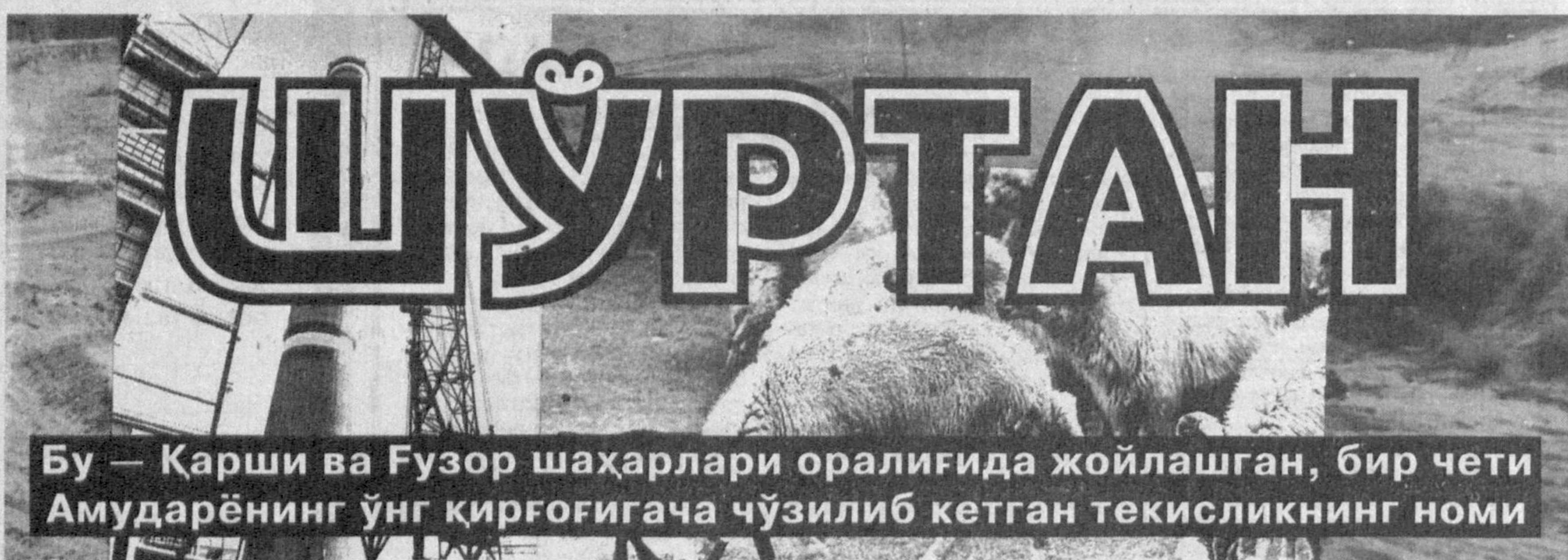
Бу — Қарши ва Ғузор шаҳарлари ораллиғида жойлашган, бир чети Амударёнинг ўнг қирғоғига чўзилиб кетган текисликнинг номи

Биз «Ўзбекистоннинг ёқилги-энергетика ресурслари» деган янги руҳни остида газетамизнинг бугунги сонидан эътиборан шулар ҳақида ҳикоя қилиб бермоқчимиз. Биринчи мақоламиз эса Шўртан хусусида.