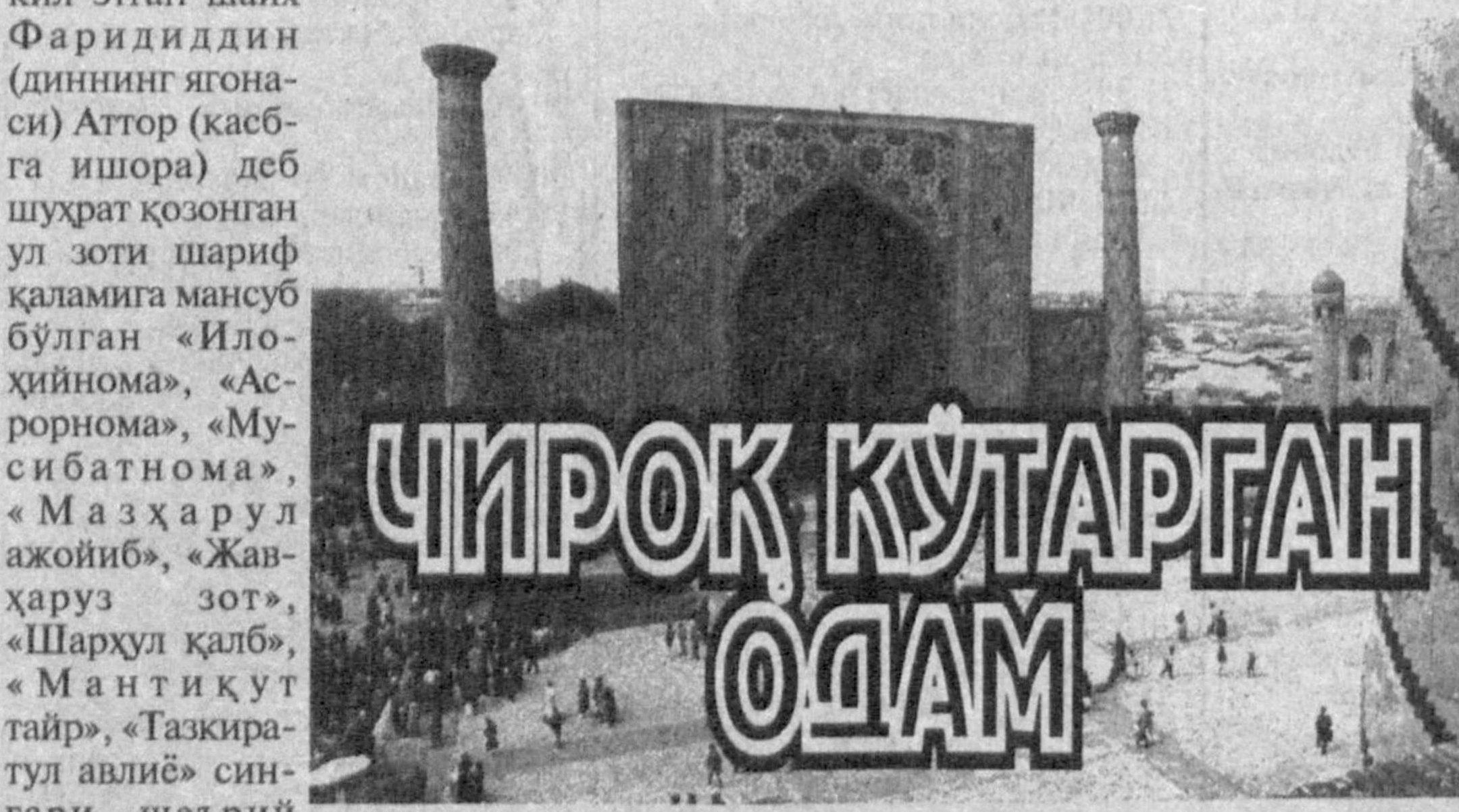
ЧИРОҚ КўТАРГАН ОДАМ

шайх Маждиддин Бағдолий қўлидан дарवेशлик ҳирқасини кийган, умр буйи сунунали меҳнат қилиб, суфия ҳикоятлари ва машойҳи ривоятларини йиққанди. Тарихчи Давлатшоҳнинг таъкидлашича, «хеч ким бунчалик маълумот, рамзу ишорат ва ҳақойиқ дақойиқ» сўзларни жамламаган эди. Жаман ижод маҳсули 250 миғ байт (яқин миллион мисра)ни ташкил этган шайх Фаридиддин (диннинг ягонаси) Аттор (қасбга ишора) деб шўҳрат қозонган ул зоти шариф қаламига мансуб бўлган «Илоҳийнома», «Асрорнома», «Мусибатнома», «Маъруза ар-руқуб», «Жанҳаруз зот», «Шарҳул қалб», «Мант иқут тайр», «Тазкиратул авлиё» сингарии шеърини