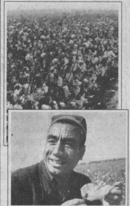
Бўз туманидаги «Озод» жамоа хўжалиги деҳқонлари бу йил 630 гектар майдонда пахта етиштиришди. Йил бошида деҳқонлар ҳар гектар ердан 29,6 центнердан хирмон кўтаришни мақсад қилиб қўйдилар.

Дастлабки натижалар шундан далабат бермоқдаки, хўжалиқда режалар зидди билан бажарилади. Ҳуночи 7-бригада авазлари режадан 30 ўрнича мавжуд 47 гектар ердан 40 центнердан хирмон кўтаришди. Режа 7 иш кунинда удоаюлади.