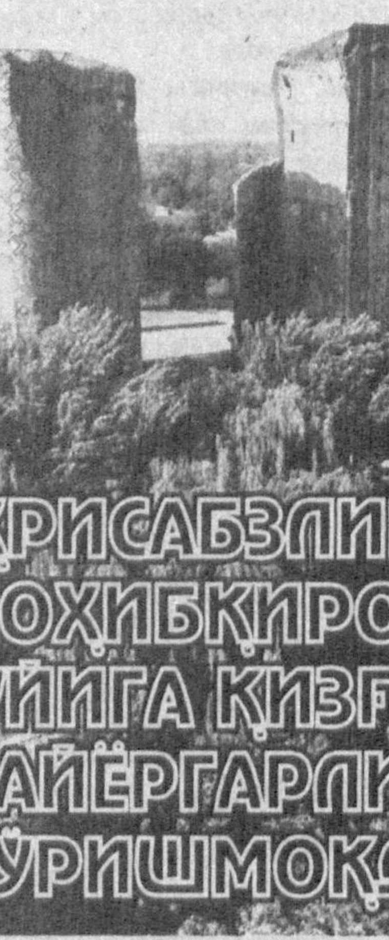
ШАХРИСАБЗЛИКЛАР СОҲИБҚИРОН ТУЙИГА ҚИЗГИН ТАЙЁРЛИК КУРИШМОҚДА