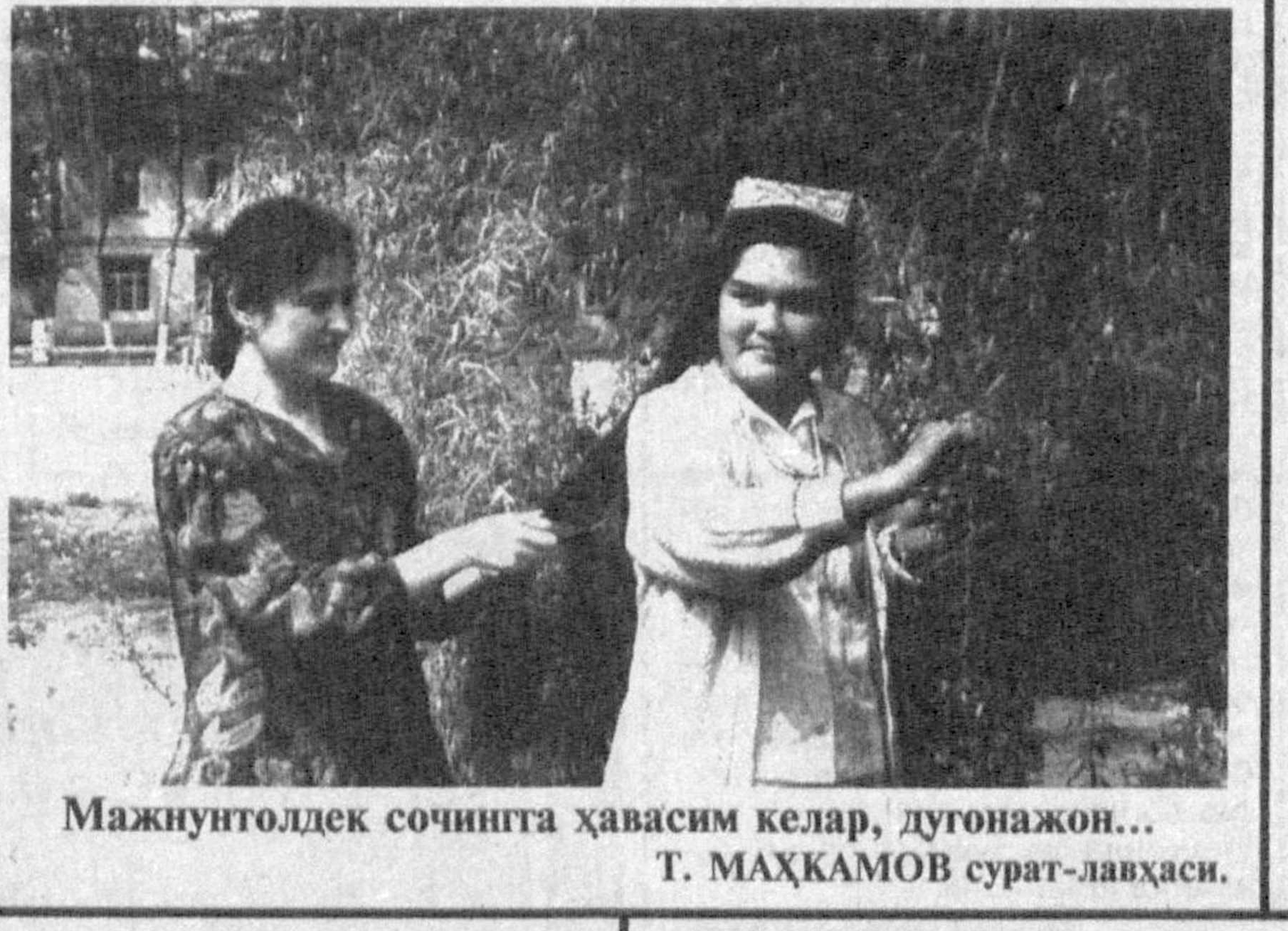
Мажнунтоддек сочинига ҳавасим келар, дугонажон...