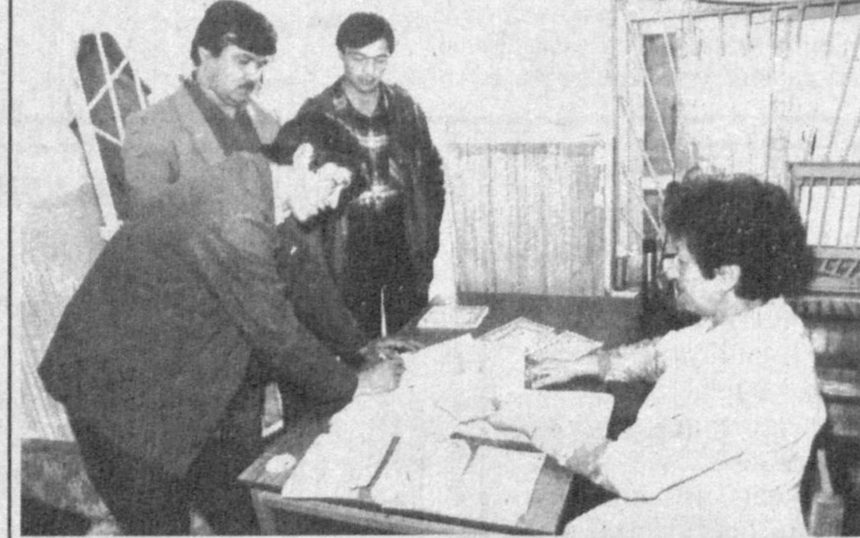
Янгиўл шахридаги ёғ-мой қомбати ҳиссодорлик жамиятига айлантириладиган сўнг маъсулот турлари ва ишлаб чиқариш сезиларли даражада кўпайди, ишчилар манфатдорлиги ошди. Бу эса меҳнатга бўлган муносабатнинг кескин ўзаришига олиб келди. Қомбатнинг бир неча ҳақларида қайта таъмирлаш ишларининг амалга оширилиши таъминотида совун тайёрлаш ойига 1300 тоннагача, ёғ ишлаб чиқариши 2056 тоннага етказилди.