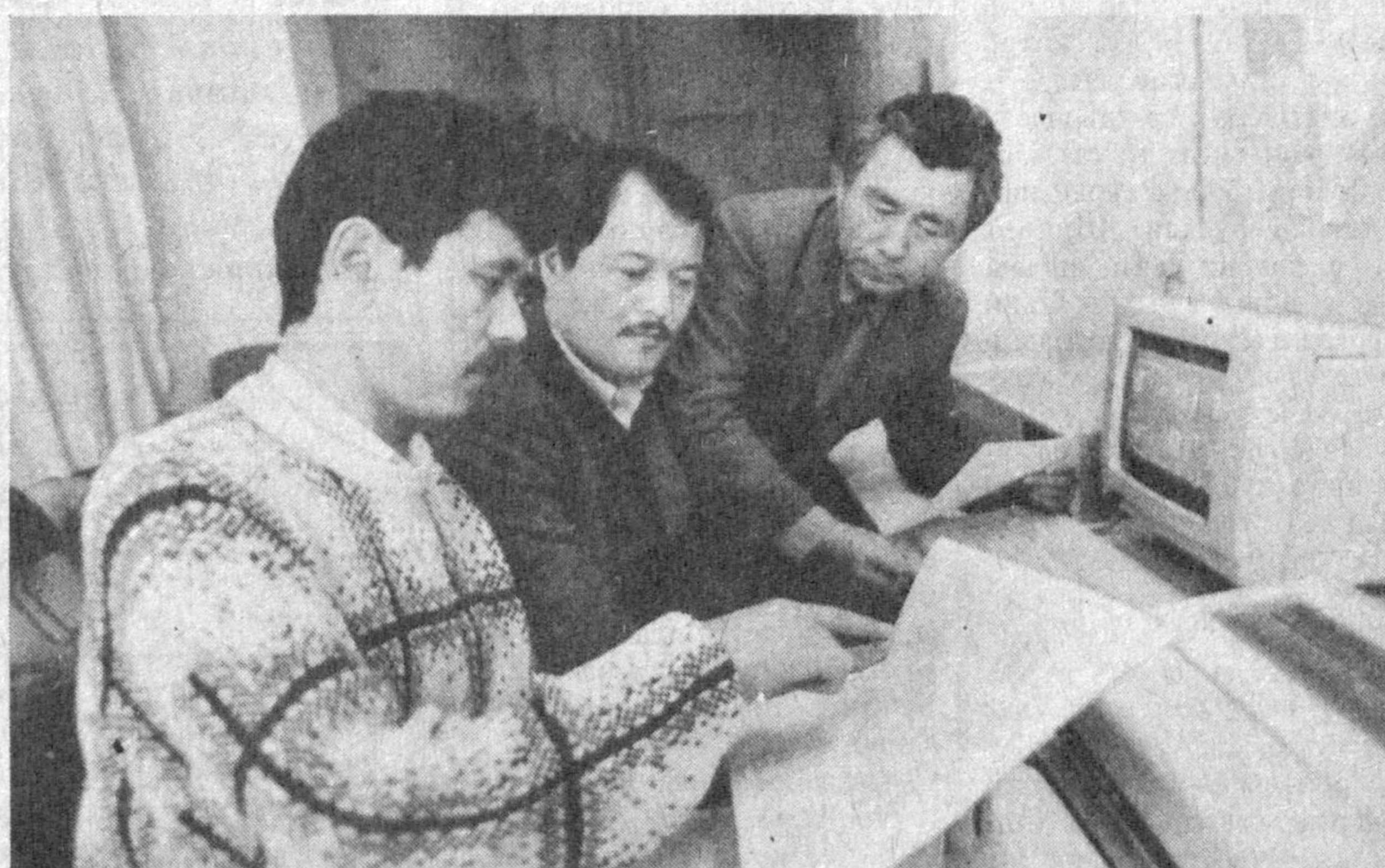
Қорақалпоғистон шаҳарлараро автомат телефон-телеграф станцияси алоқачилари бор имкониятлардан унмчи фойдаланиб, халққа намунали алоқа хизмати кўрсатмоқдалар. Айниқса, Нукус «Элект-роалоқа» бирлашмаси бу борада уларга яқиндан ёрдам берапти.